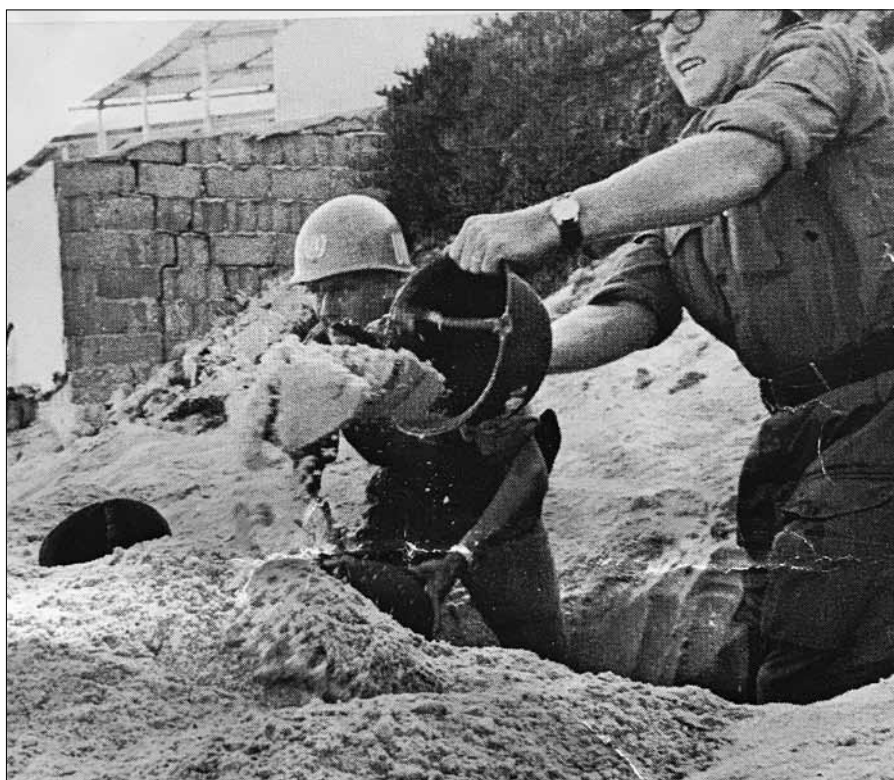
Vi grävde våra skyddsgröpar med hjälmarna