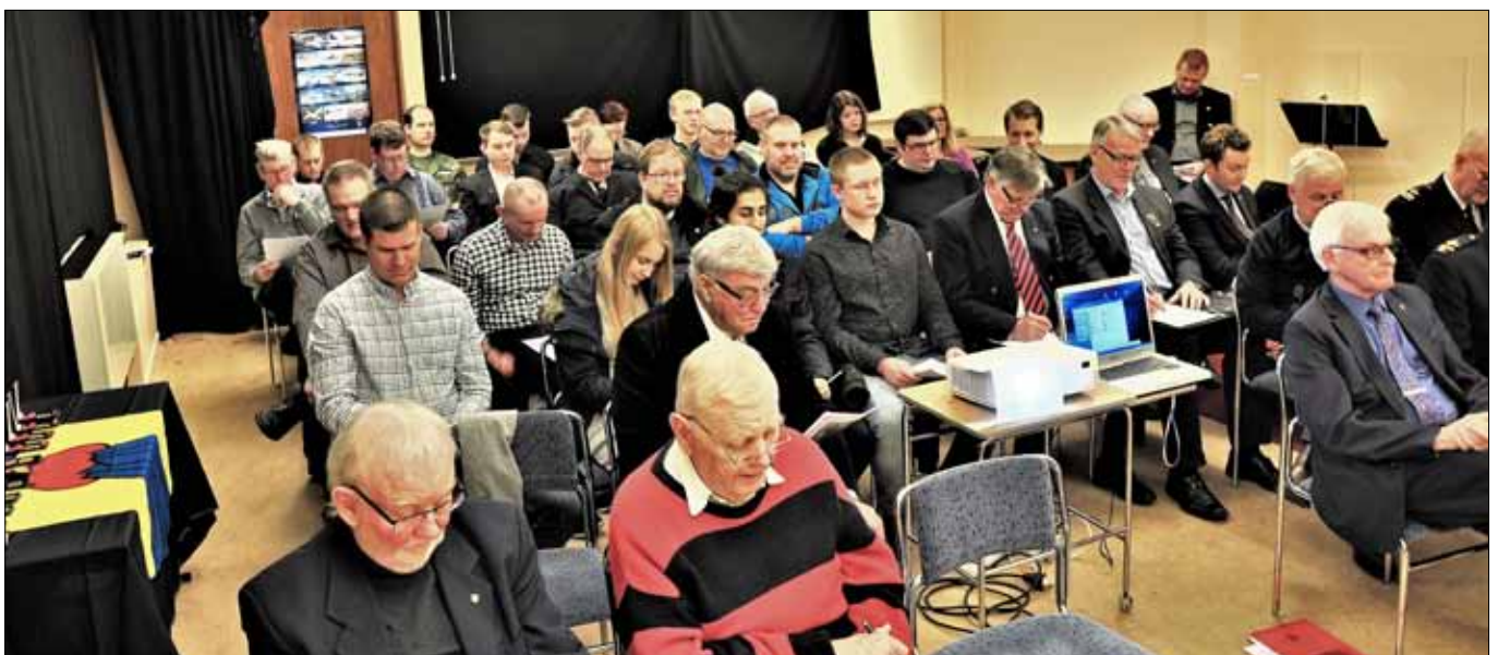
Medlemmarna samlade till årsmöte på F 10 museum