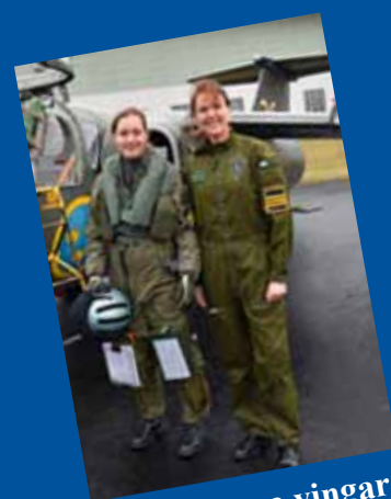
Lovisas nya vingar