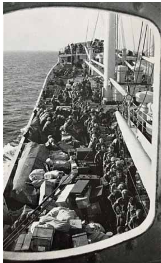
FN-trupper evakueras till Cypern med M/S Thuleland

I slutet av kriget evakuerades vi med israeliska bussar till hamnstaden Ashdod, där gick vi ombord på det svenska fartyget M/S Thuleland som skulle ta oss till Cypern. På fartyget var vi FN-soldater från flera andra nationer. Det var ont om plats på fartyget så vi sov på däck, i lastrum och överallt där vi hittade en ledig plats. Väl på plats på den svenska FN-