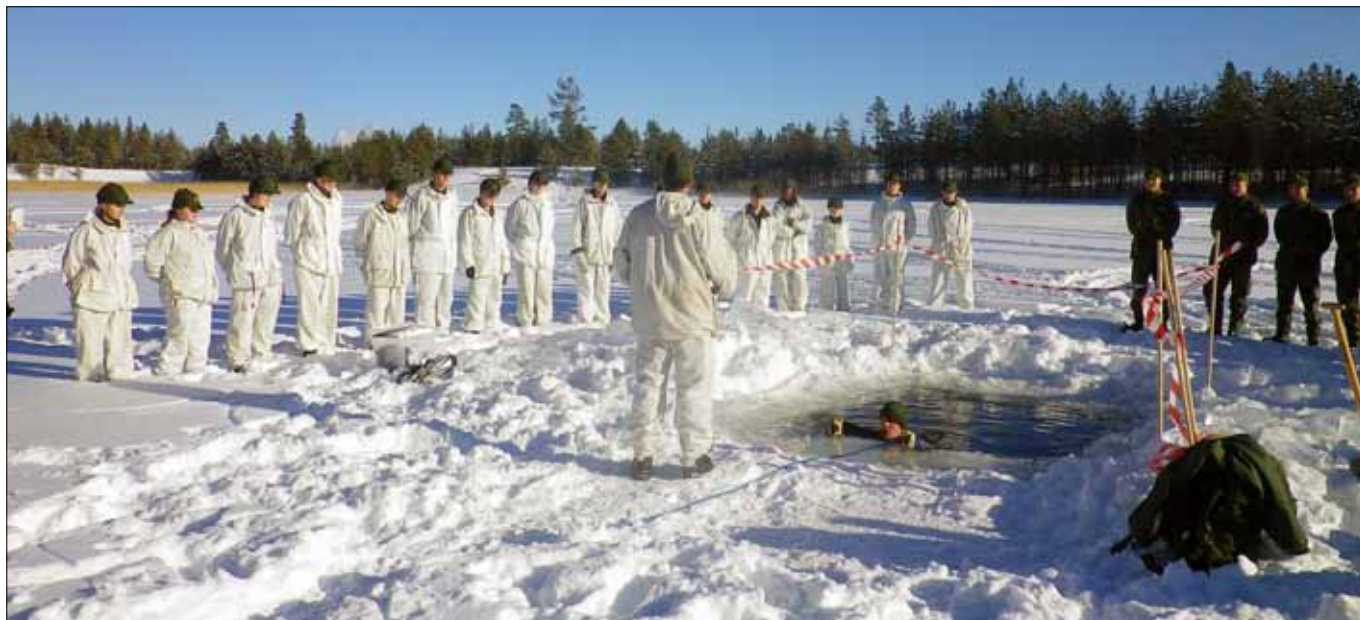
Bada i Isvak, jättenyttigt och inte så kallt som man tror

simträningen. Där fanns elever som tvivlade på sin egen förmåga när det gällde att simma 1000 meter, men det är förundransvärt vad man kan lyckas med om man bara försöker.