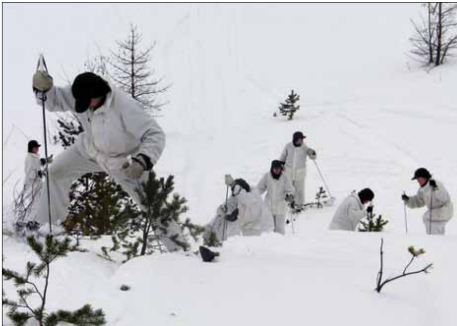
Utförsäkning är att föredra, men upp kom vi till slut

Efter en god natts sömn var vi inne på den sista dagen i fält. Nu gällde rivning av förläggning, skidmarsch tillbaka till flottiljen, vård av gemensamt och personligt material innan