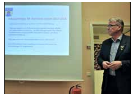
RFS ordförande informerar om Flygvapenfrivilliga och dess framtid

F 10 "gamla" Officersmäss blev nästa punkt på programmet där deltagarna samlades till en mycket trevlig