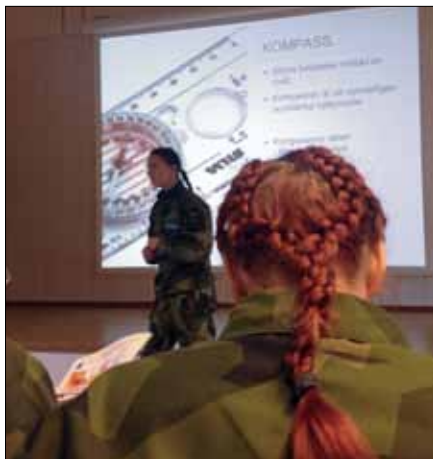
Elevlektion i karta och kompass

Tidig vår i Kallinge? Ja säga vad man vill om väder men under våra två utbildningsveckor i februari hade kursen IK G på F 17 alla typer av väder, allt från snö till strålande sol.