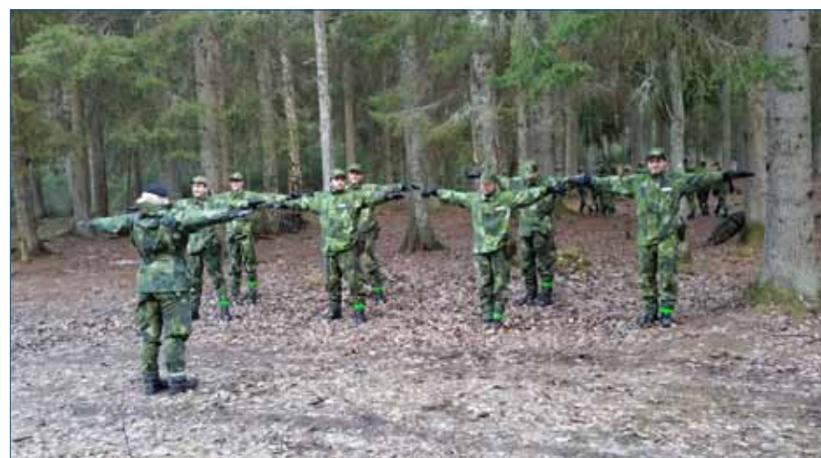
Morgongymnastik under fältförhållanden, mycket nyttigt

På söndagsmorgonen var det dags att riva förläggningen. Sedan var det sjukvård och en förevisning av olika vapensystem som avslutades med materiellvård. MW började nu lida mot sitt slut, utvärderingar skrevs samtidigt som avsked gjordes mellan nya vänner och sedan satt samtliga i respektive fordon med kursintyg i hand och helgen var slut lika snabbt som den började.