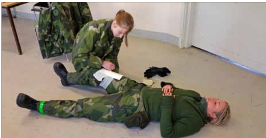
Sjukvård Military Weekend

Väl ute i terränglådan stod de flesta initialt och kliade sig i huvudet och försökte dra sig till minnes vad instruktörerna sade och visade om hur man resa ett tält 20, men med lite tid och diskussion så stod ett tält klar komplett med eldstadsbegränsning,