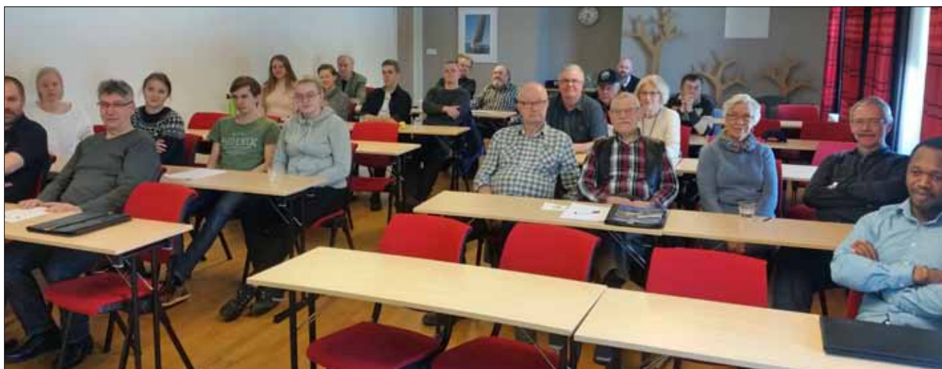
Medlemmar i Region Nord samlade till årsmöte