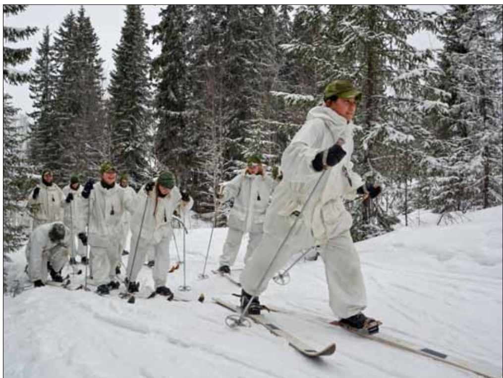
Glada miner när det var dags att prova på vita blixten

Redan på kvällen anlände bussen för att påbörja vecka 10 vinterutbildning. Eleverna kom nu från Stockholm med både svenska och estniska deltagare. Vecka 10 har sedan flera år varit vår traditionella utbytesvecka med våra vänner ifrån Valga i Estland. Även i år deltog de med 20 deltagare. Utmaningen ökade då all utbildning genomförs på engelska. Skidorna tjärades, tillpassades och dagen avslutades med genomgången av utbildning "kallt väder".