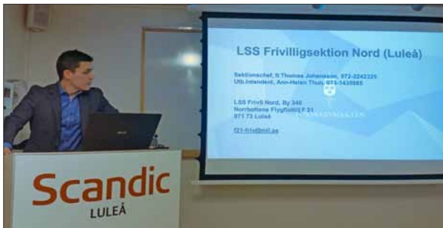
C Friv-sekt informerar mötesdeltagarna om kommande verksamhet