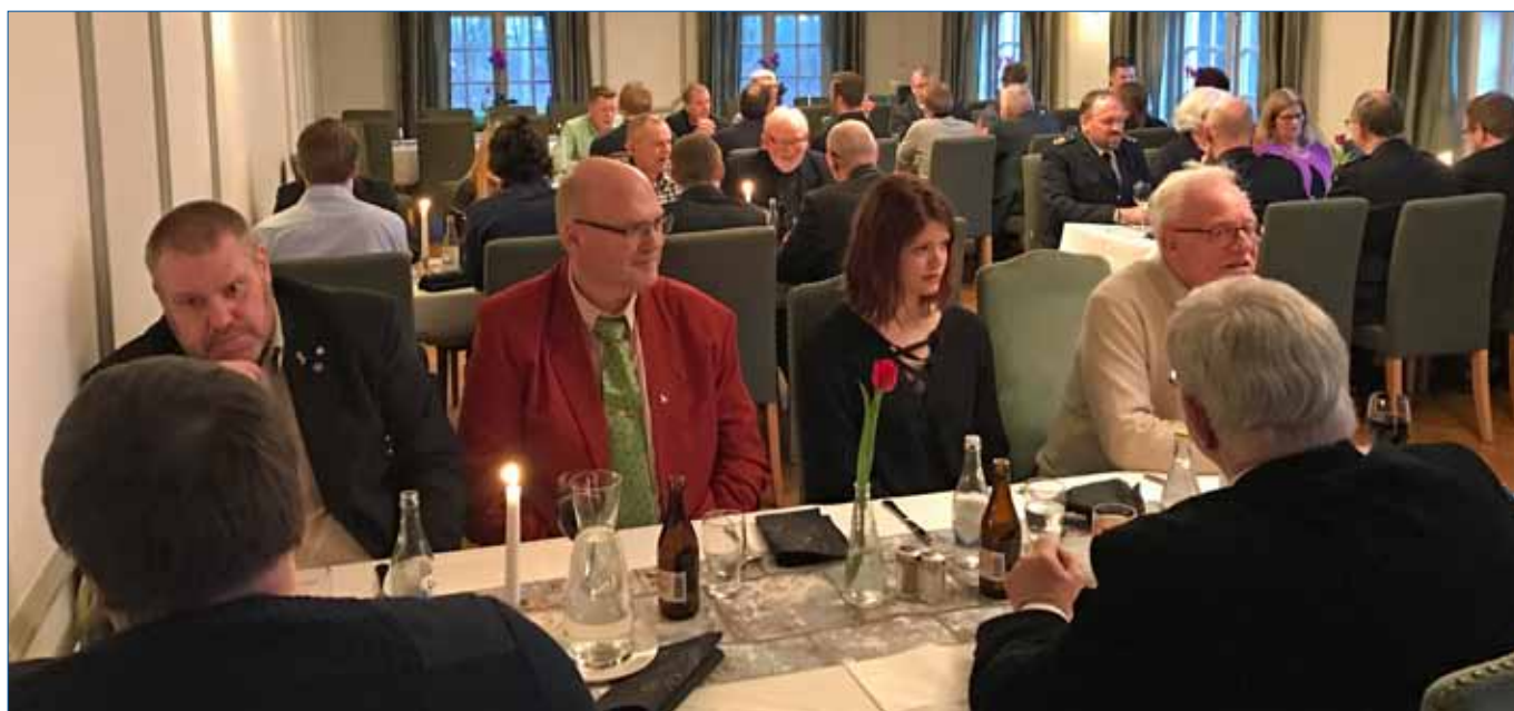
Gemensam middag på fd F 10 Officersmäss