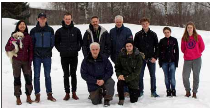
Gruppfoto av deltagarna

Filippa Kronsporre/Region Mitt