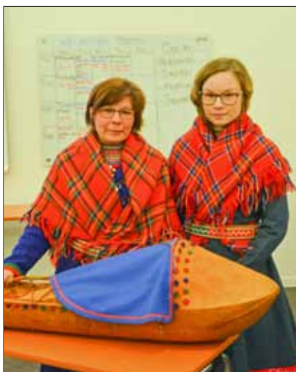
Besök på kulturfärd från samerna i området

rast förklarades och eleverna fick tillämpa detta ett antal gånger under veckan. Utbildningen var tidvis uppdelad på två tåter, eleverna fick bli lära sig att elda på snö, dra pulka både med och utan last samt att gräva bivack. En av kvällarna besöktes vi av två samer som berättade om deras kultur, liv och historia.