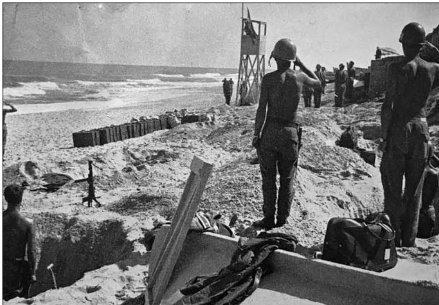
Här firar vi Svenska flaggans dag på ett annorlunda sätt