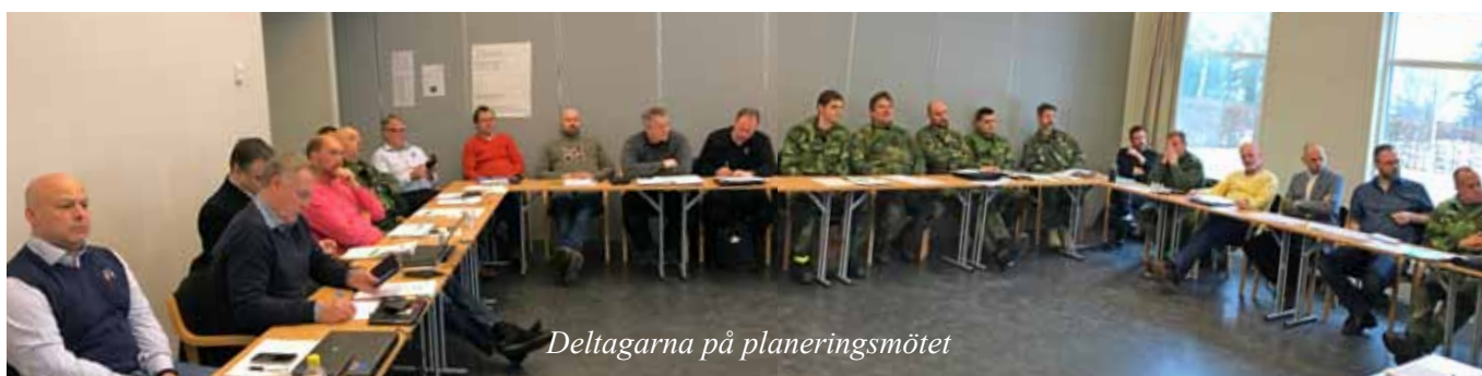
Deltagarna på planeringsmötet