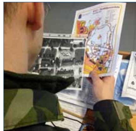
Jaha, vad gäller, kartan eller verkligheten

Under kursens gång har jag som kurschef fått se deltagare och instruktörer, tillsammans och som individer utvecklas i sin ämneskunskap,