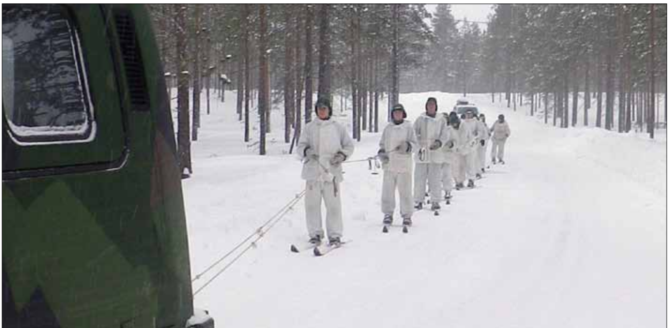
Skidtolkning efter Bandvagn, häftigt värre, vilka har gjort det?