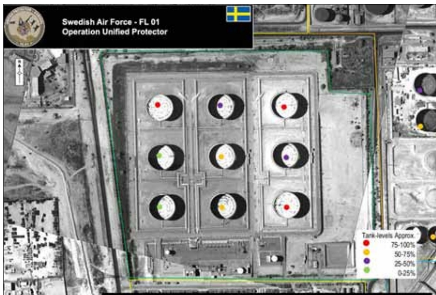
Ovan ses ett spaningsfoto tagen i då uppgiften var att skapa underlag till beräkning av kvarvarande drivmedel för Gaddafi regimen.

Under många av flygpassen skiftade vi ofta i luften mellan de olika rollerna och det blev mot slutet av missionen