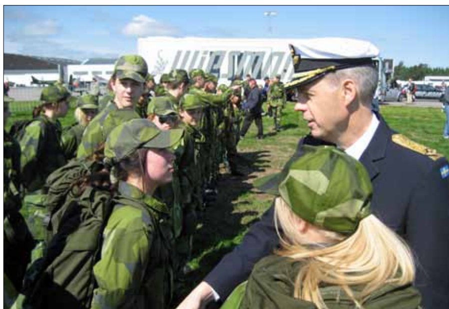
Flygvapengeneralen med FVRF-ungdomar