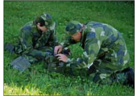
Upprättande av radio 180 under en lektion i sambandstjänst.

Programmet för veckan har arbetats fram av Mats Karlström och Christer