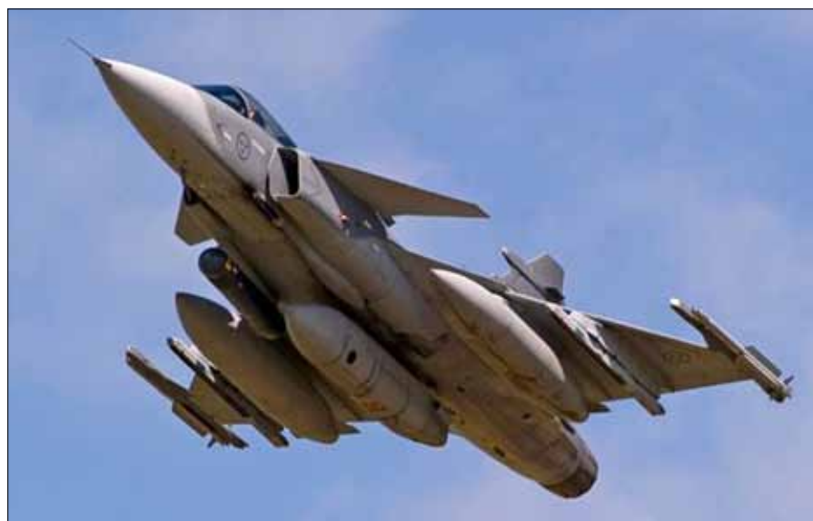
Under ett företag likt ovanstående var flygplanen utrustade enligt det som syns på bilden ovan, det vill säga spaningskapsel, laserkapsel (LDP), samt IR-robot (IRIS-T) laddad automatkanon, facklor och remsor, detta för självförsvar.