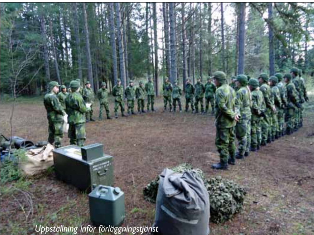
Uppställning inför förläggningstjänst