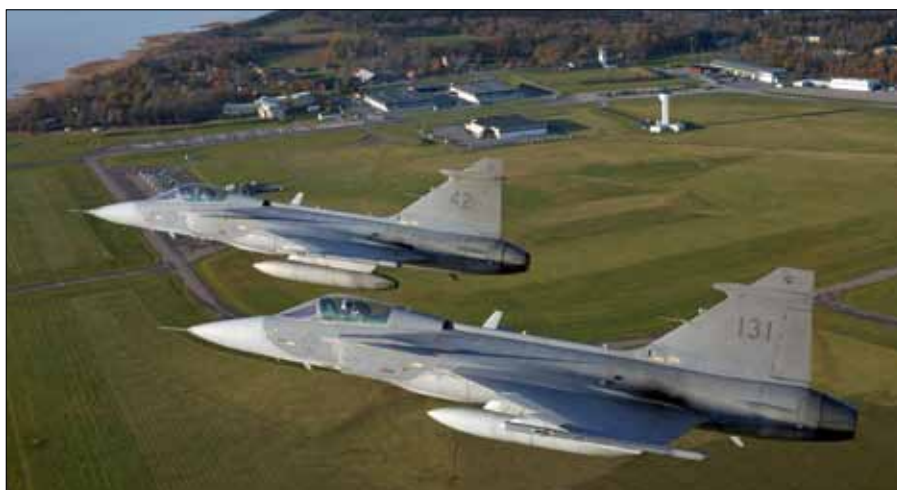
En rote JAS 39 Gripen över F 7 Såtenäs.

Under TSFE:s ledning sorterar också verksamheten med signalspaningsflyg och flygande radar-