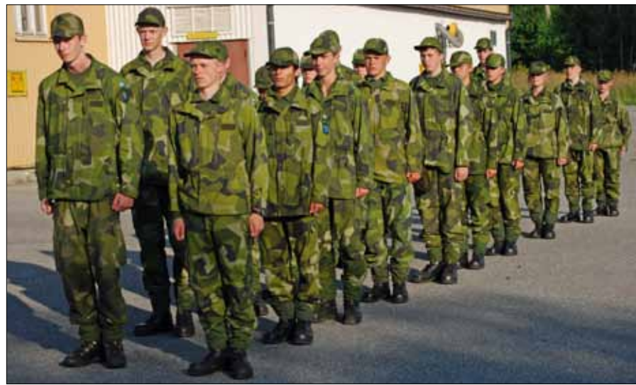
Rättning - framåt! Ett exercispass i kvällssolen över Frösön.