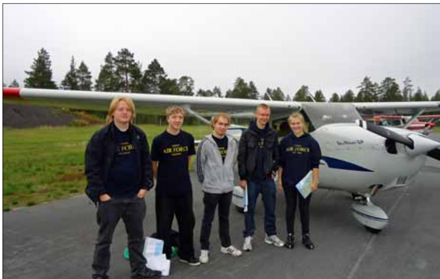
Text: Eleverna uppställda för första flygpasset på platta 8 på F 21

Lördag 10 september kl 1300 var det inryckning på F 21. Därefter fick eleverna en teorilektion om flygning rent allmänt samt hur man navigerar. Efter teoripasset blev det praktiska övningar där eleverna fick göra sig hemmastadda i tilldelade flygplan, lära sig vad de olika instrumenten visade samt genomföra två flygpas. Kvällen ägnades åt ledarskapsutbildning och fysisk aktivitet.