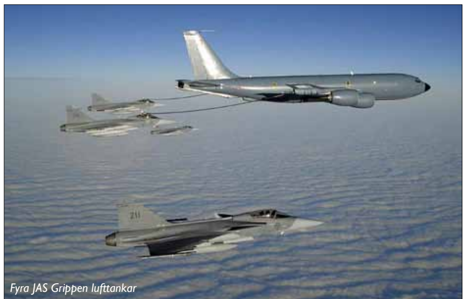
Fyra JAS Gripen lufttankar

Basen Sigonella ligger på östra Sicilien, nära staden Catania. Basen är ursprungligen en Italiensk bas avsedd för flyg med uppgiften havsövervakning. Halva basen långtidshyrs av USA, och används bland annat som transit bas för flygningarna