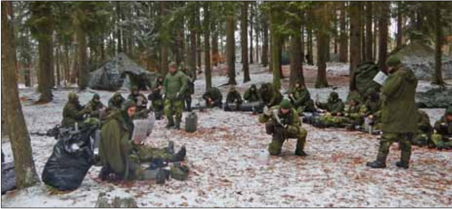
Nu börjar det bli något, här kommer vi att sova gott