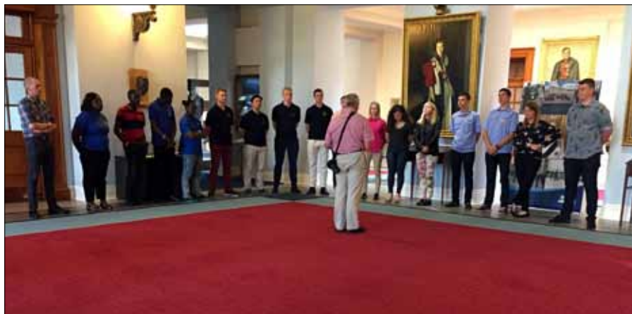
Den röda mattan i foajén på RAF College Cranwell, som bara officerare får beträda.

1300-talet var imponerande. Katedralen hade också ett kapell för RAF där nedlagda RAF skvadroners flaggor förvarades.