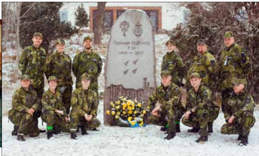
Tolv nöjda och aktiva elever