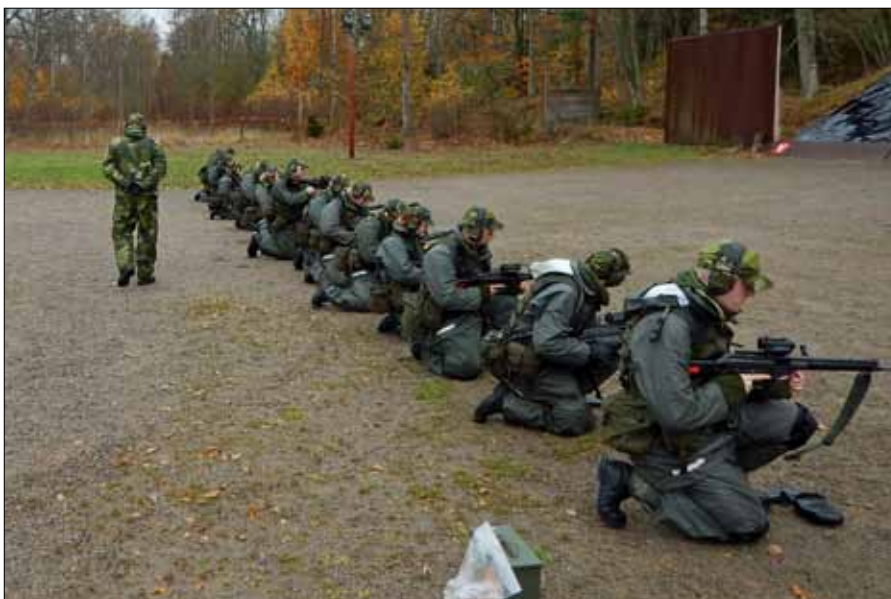
Så var det dags att skjuta knästående, lite svårare än liggande

Till den sköna logementssängen på kasernen även att logementskompisar snarkar i fler stämmor än vad det sjungs på kungliga operan så gör det inget. Känslan av att sova i skogen i detta väder är allt annat än känslan man har inför en vecka på Kanarieöarna. Men efter en kvällsgrill och lite prat med befälslaget samt skolchefen som självklart gästade i skogen så somnade båda tärtlagen ovaggade och endast eldposten var vaken, Alla vaknade något förvånade över att det gick faktiskt att sova i skogen i snöblandat regn i södra Sverige utan att frysa ihjäl. Sista natten i skogen sovs det ännu hårdare och självklart så väcktes båda tärtlagen av en