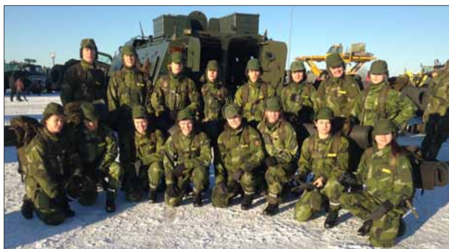
Gruppbild framför SISU

Söndagen fylls sedan med fakta-kunskap om Försvarsmakten i allmänhet och yrkesinformation i synnerhet. Hemvärnet är på plats och pratar om sin värld lika självklart som rekryteringskoordinatoren pratar om Försvarsmakten och vägarna in till yrket som soldat eller officer.