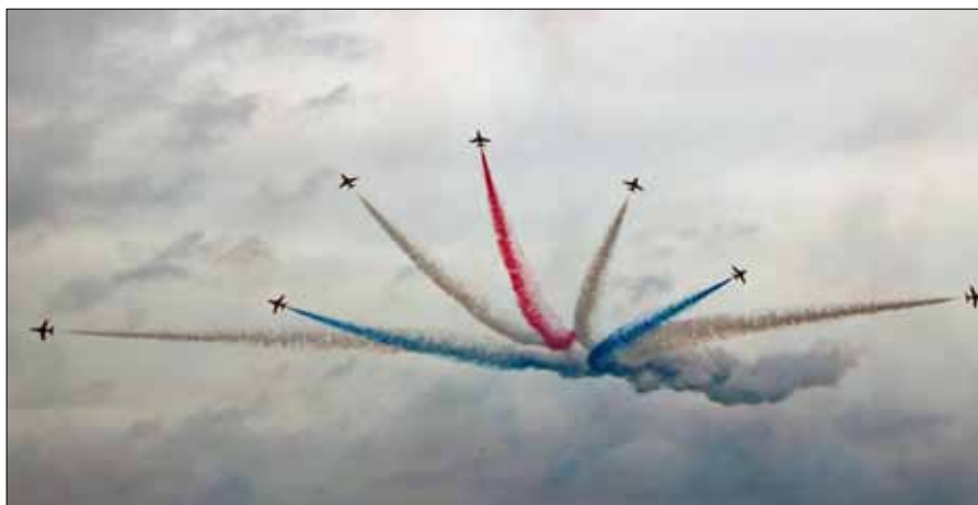
RAF uppvisningsgrupp Red Arrows flyger på RIAT.

besök på RIAT-Royal International Air Tattoo, på RAF Fairford. Av siffrorna ovan att döma är det inte så svårt att föreställa sig att det första som mötte oss vid ankomst var värdorganisationens storlek i jämförelse med vår egen. Man hade samlat cirka 1000 ungdomar från hela Storbritannien i ett stort tältläger vid Fairford för att bistå RAF med arrangemanget av flygshowen. Våra ungdomar tillsammans med ungdomar från Ukraina och Ghana,