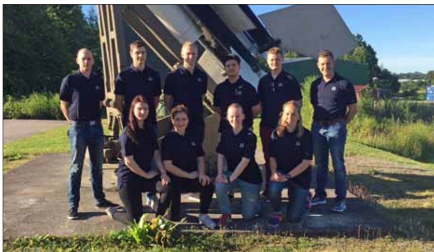
Glada ungdomar och ungdomsledare på väg till Storbritannien och RAF Air Cadets!

Redan innan resan påbörjades genomfördes en introduktionshelg, där de ungdomar som blivit uttagna från respektive region fick