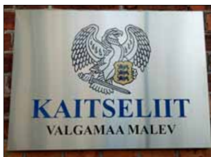
Vårt värdförbands Förbandstecken

Den 22 augusti åkte 15 ungdomar ur FVRF Region Mitt med instruktörer till Valga, i sydöstra Estland. Målet var att knyta band med ungdomar och instruktörer ur KaitseLiit, deras hemvärnsorganisation, och att delta i deras årliga ungdomstävling "Kuperjanovlaste rada". Tävlingsnamn härrör från Julius Kuperjanov, en av de stora frihetskämparna under frihetskriget 1918-1920.