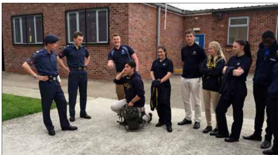
Besök vid No. 2160 Sleaford Squadron. Sambandsutbildning, ungdomarna pratar och jämför hur vi utbildar i våra olika organisationer.

en traditionstyngd plats där RAF grundläggande officersutbildning bedrivs, omgivningarna är vackra och besöket på skolan med dess historia gav alla ett bestående intryck.