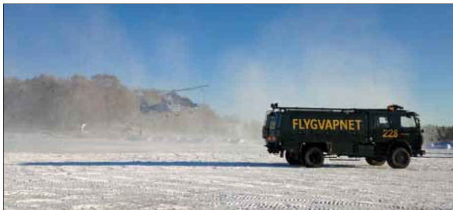
Spännande förevisning med helikopter och räddningsfordon

Under kvällen får eleverna information om LSS och en noggrann genomgång av de villkor och regler som gäller innanför förbandets staket. Värdegrund, ÖRA, betonas och alla som är med i lektionssalen är efter detta medvetna om vad som förväntas av dem, men också vad de kan förvänta sig av oss!