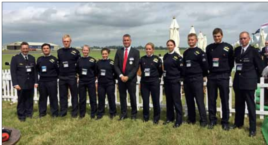
Med flygvapenchefen Generalmajor Mats Helgesson på RIAT.

som också ingick i utbytet, fördelades ut i grupper med de engelska ungdomarna och fick arbeta med att stödja arrangemanget. Uppgifterna varierade, och innebar allt från att bära stolar till åskådarläktarna till att plocka skräp invid flygbanorna. Motprestationen var att ungdomarna fick fri tillgång till showen och i vissa fall även bättre access än de civila besökarna.