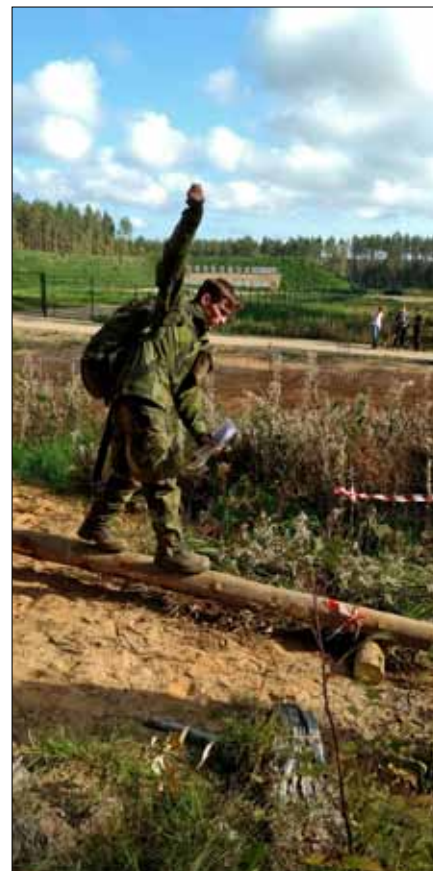
Här gäller det att hålla rätt på både balans och packningen

Tävlingen beskriver ungdomarna själva nedan men sammanfattningsvis kan sägas att den är fysiskt krävande då de under ett drygt dygn förflyttar sig flera mil och periodvis måste uppträda försiktigt om de