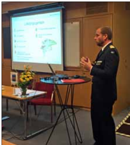
C Hkpfly Överste Peder Söderström