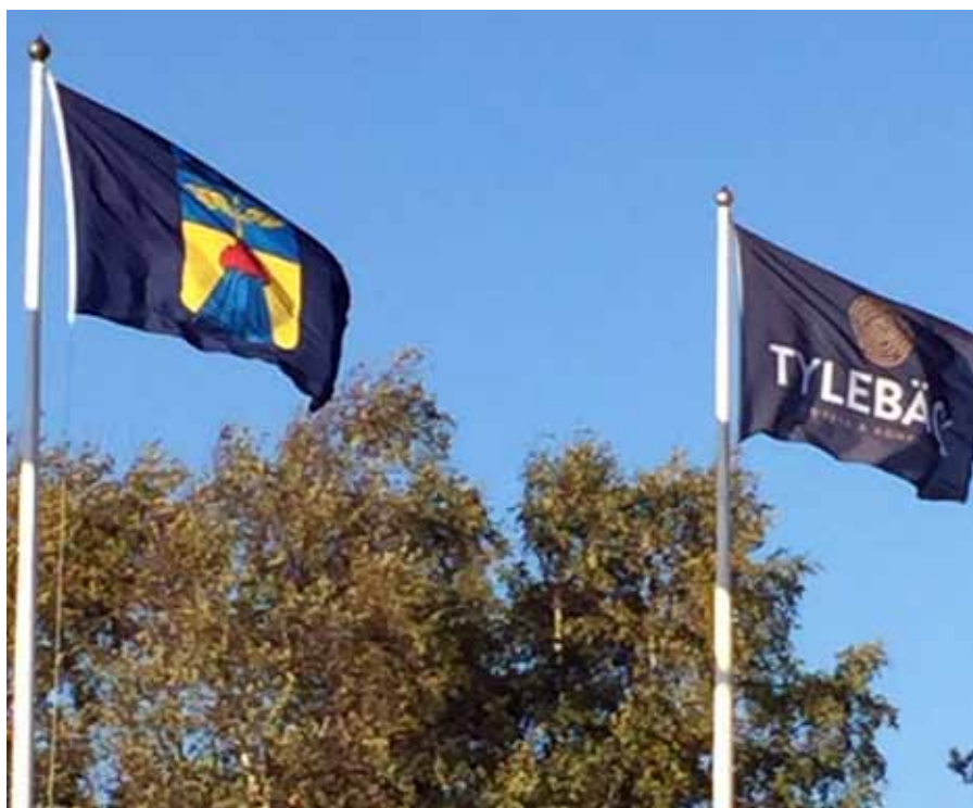
Konferens på Tylebäck kursgård

Helgen den 24-25 september genomfördes den årliga Instruktörskonferensen med Flygvapenfrivilliga som kursansvarig. Konferensen som om några år firar 20 års jubileum var i år förlagd till kursgården Tylebäck utanför Halmstad. Under utbildningshelgen deltog ca 30 instruktörer från sex av våra frivilliga försvarsorganisationer, men frågan är, när kommer alla FFO att vara med? Kan vi hoppas på nästa år.