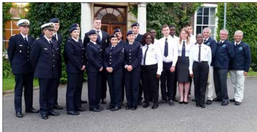
Våra ungdomar tillsammans med ungdomar från Ukraina och Ghana.