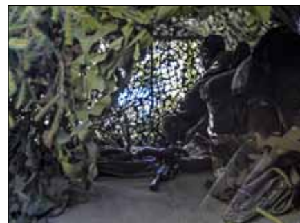
Spaning från en väl dold O-plats

På söndagen förstärktes instruktörslaget av kn Eriksson, som då tidvis gick in och tog rollen som gruppchef. En kortare rörlig spaning genomfördes i närområdet under söndagen. Därefter genomfördes en samverkan med en spelad insatsplutonchef. Därefter tog hemvärnet över uppdraget fast spaning och gruppen fick lite tid för omplanering och genomförde sedan rörlig spaning och skiss mot objektet "förrådet". När uppdraget var klart omgrupperade gruppen till en punkt för upplöckning, varefter gruppen hämtades och kördes till en plats där taktisk avrapportering genomfördes. Där kom man fram till