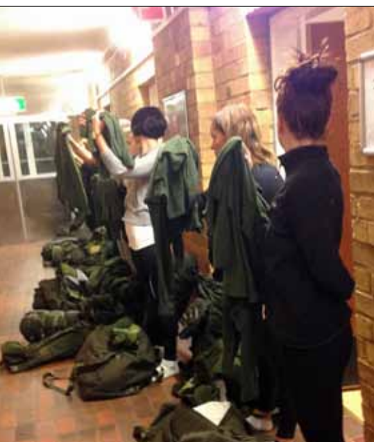
Inventering av vår militära utrustning, så mycket det blev

De flesta som förväntas komma ansluter. Med fölgebefäl beger sig eleverna mot Kasern 21 för att mönstra in och sedan bege sig till förrådet för att utrusta. Servicecentret vid LSS har förberett inryckningen och allt går enligt plan. Vintermössor och sovsäckar, kängor och fältskjortor samt andra nödvändiga persedlar.