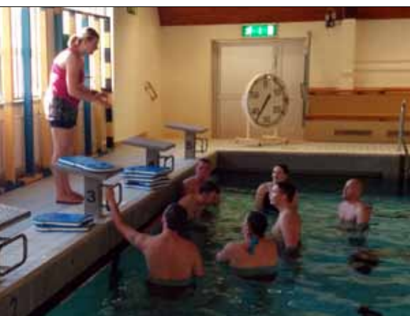
Elevlektion i badhus

Under kursen har vi fokus på målgruppen ungdomars behov, möjligheter och utveckling och anpassar därför verksamhetsplanering och säkerhet utifrån behov och förutsättningar. Vi nyttjar LSS simhall för att genomföra handledda elevlektioner inom ungdomspedagogik och verksamhetssäkerhet.