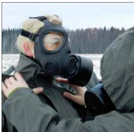
Tillpassning av skyddsmask

Utbildningen syftar till att ge eleverna sådan militär förmåga så att grundläggande befattningsutbildning och fortsatt träning i krigsförbandets ram därefter kan genomföras.