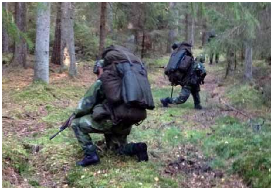
HvUnd-soldater under framryckning

som spaningssoldaternas information bearbetas vilka därefter delges till egen chef och stab såväl till underställda egna förband men även till högre chef.