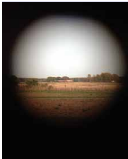
Spaningsobjektet sett genom kikaren

Målet med kursen har varit att deltagarna ska få den kunskap och förståelse samt färdighet som behövs för att kunna verka som underrättelsesoldat. Tidigt fick deltagarna veta hur viktigt det är att information och/eller underrättelser som fås genom spaning kommer chefen tillhanda i rätt tid och med snabb rapportering till rätt mottagare och med stor precision är av största betydelse för de egna förbandens framgång. Det är sedan på bataljonens underrättelsesektion