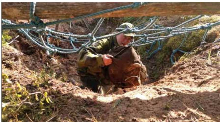
Här gäller det att inte fastna i nätet, samt att komma upp ur gropen