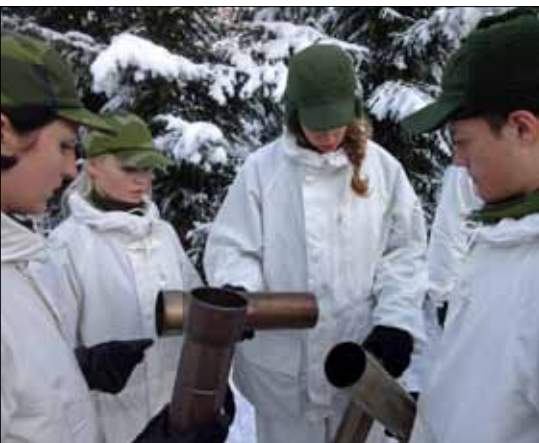
Jaha, kapten sa att det skulle bli en skorsten

nusgrader. Även kunskaper om hur man på ett säkert sätt hanterar vassa föremål såsom kniv, yxa och såg står på agendan.