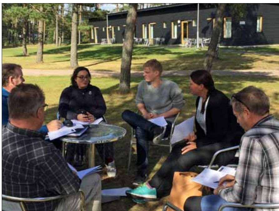
Grupparbete men det ”Goda exemplet”