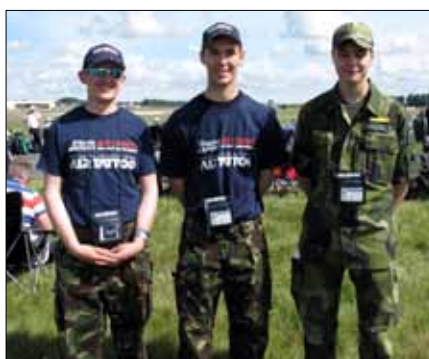
Arbete tillsammans brittiska ungdomar på RIAT. Här på "Park and view", där flygentusiaster kunde sitta invid landningsbanan när flygplanen anlände till showen. Ungdomarna skötte renhållningen på plats och såg till att det var snyggt och prydligt.

Efter Fairford fortsatte resan runt södra England. Studiebesök gjordes på RAF College Cranwell, där det ingick flygning i simulator och på riktigt med No. 45 Squadron, som genomför utbildning i flermotoriga flygplan s.k. Multi Engine Advanced Flying Training för RAF med flygplanet Beechcraft King Air B200. RAF Cranwell är