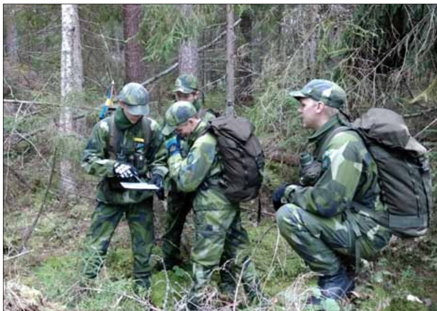
Många vägval, men med karta, kompass och gruppbeslut hittade vi rätt