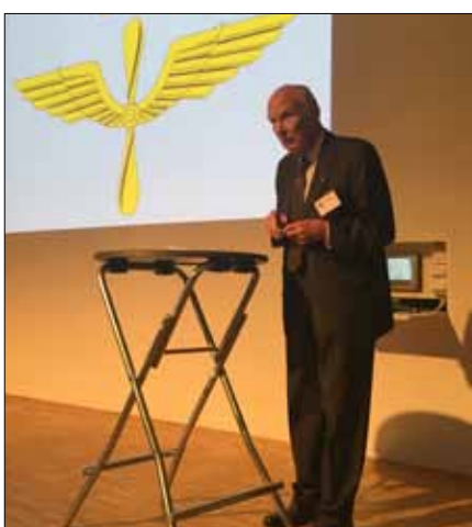
89-åriga Generallöjtnant Sven-Olof Olssons exposé om FV 90 år