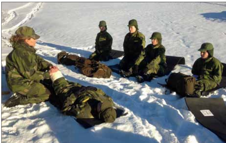
Sjukvårdsövning i Kung Bores land

Dagen som följer är full med aktiviteter. Eleverna får genomgångar och prova på omhändertagande av skadad. De får öva på hur ett jägarkök fungerar och erfara att det kan vara svårt att få eld på ett spritkök i mi-