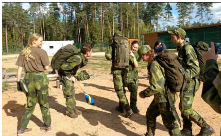
Äntligen i mål efter 27 timmars hårt slit