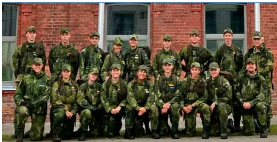
Hela truppen från FVRF samlad för tävlingar och kamratutbyte i Estland

Nästan alla lag missade en eller flera kontrollpunkter pga att de gick fel i den täta skogen. Kartläsning och vägval var viktigt och de svenska ungdomarna fick verkligen testa på detta. En stor skillnad mot de estniska var att i stort sett alla där använde GPS som hjälpmedel.