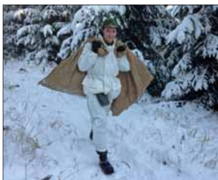
Mycket ved och ett glatt humör så ska det nog bli varmt i tältet

Denna helg hade även 5:e baskompaniet en anhörigdag för sina ineliggande soldater. Genom att samverka med kompaniet kunde vår