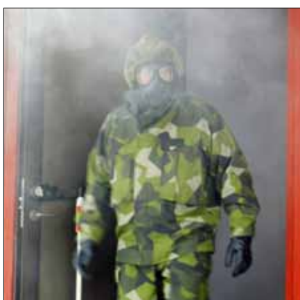
Täthetsprov av skyddsmask

Vapenutbildningens innehåll och omfattning utgör lägsta nivå för att kunna tilldelas ett eldhandvapen vid övning, utbildning eller tjänstgöring. Efter genomförd utbildning ska den krigsplacerade kunna försvara sig själv och tillsammans med andra