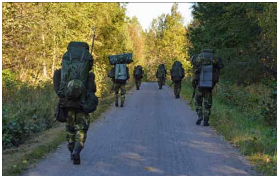
Spaningspersonal rycker fram mot grupperingsplatsen

Gunnar Larsson/Kursch Fk HvUnd, Foto: Ulrika Leijon