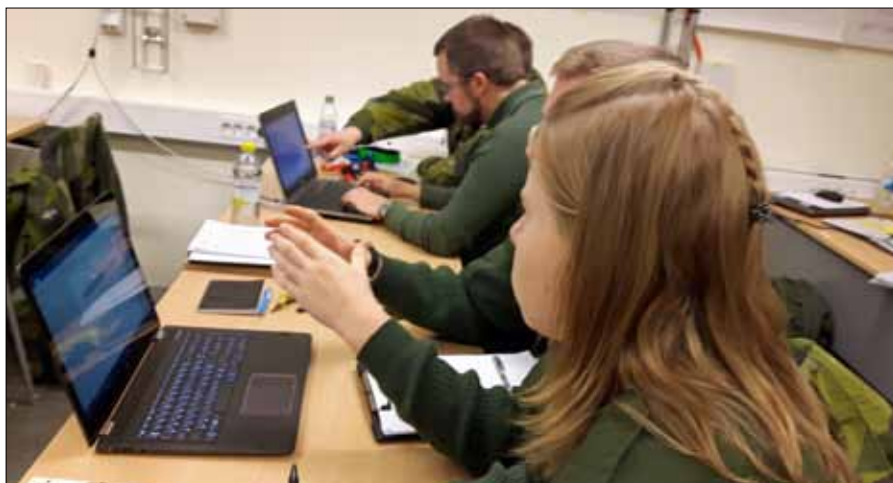
Tunahuset ”Kommendörkaptenen”

Under kursen anpassas övningar och PM för ungdomsverksamheten efter värdegrund, ungdomspedagogik, metodik och ungdomspsykologi. Instruktörerna skall leda kunskaps-sökande processer, möjliggöra lärande situationer och samtidigt tänka på att vara omtänksamma föredömen. Kreativiteten och erfarenhetsutbytena bland kursdeltagarna emellan är aktiv. Att utbilda ungdomar kräver mer av dig som instruktör än vuxna manar kurschefen Mikael Sjöberg.