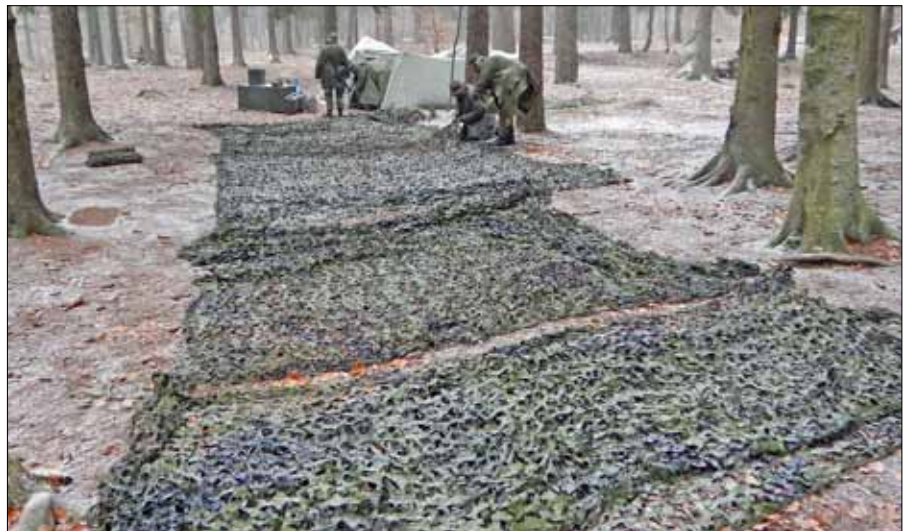
Här ska vi bo, kommer det att bli någon förläggning

Efter två veckors hårt jobb så blir det lite av ett slutprov med fälttjänst, och tillämpningsövningar. Som pricken över ett i så faller självklart den första snön i Blekinge och självklart blir det kallt, blött fuktigt och man vill inget annat än att komma in i värmen.