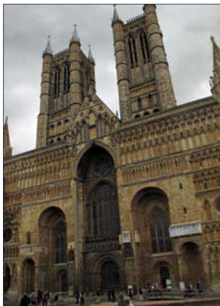
Den imponerande katedralen i Lincoln, färdigställd på 1300-talet

Utbytet sommaren 2016 i Storbritannien blev ett minne för livet för våra ungdomar och för oss