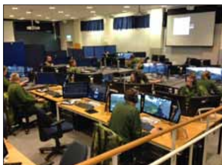
Övningsanläggning på STRILS

IK UP inleder kursen med ett studiebesök i övningsanläggningen StriSim Pc för att skapa motivation och inspiration inför framtida verksamhet. Besöket inleds med en introduktion och därefter får vi möjlighet att prova på att ”spela”. Det blir snabbt lustfyllt och engagerande. Möjligheterna att simulera, skapa målbilder och öva utan större kostnader och risker är utvecklande och inspirerande för framtida kursverksamhet.