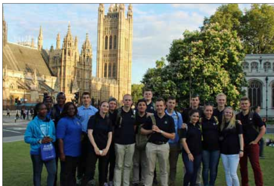
Hela utbytet framför Houses of Parliament i London.