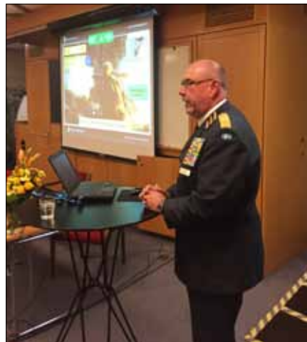
Rikshemvärnschefen Brigadgeneral Roland Ekenberg