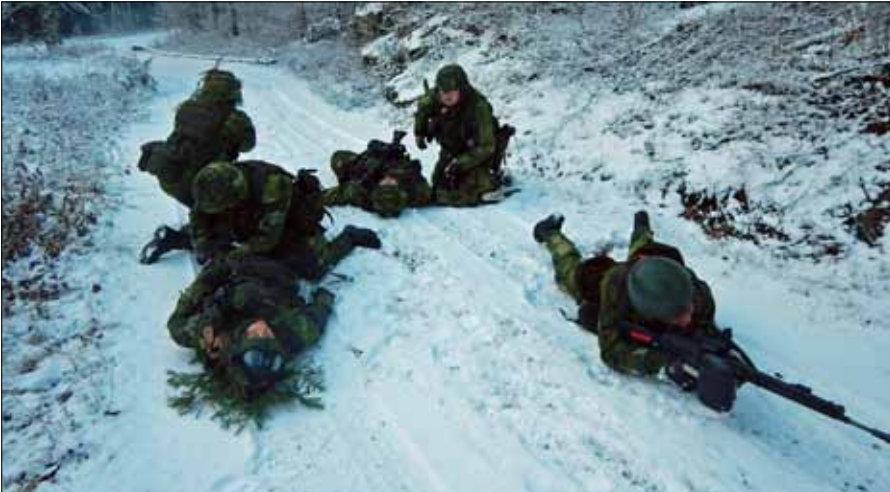
Två skadade, snabbt igång med första hjälpen

”övertäckning” i Arla morgon stund och alla deras utbildningsmoment sattes på prov. Förläggning ska rivras och det skall återställas snyggt och fint. Alla är trötta, lite kalla och det finns knappt en strumpa torr men ändå kan man hitta ett och annat leende med ett ”fassiken” vad kul vi har.