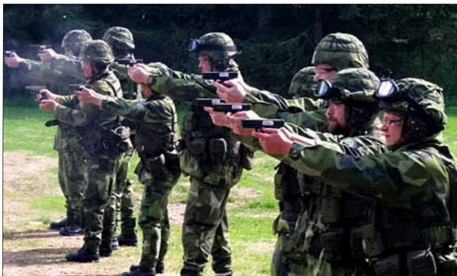
Skyttar in action