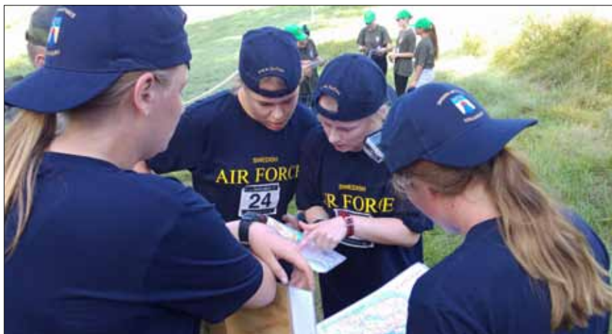
Tjejlaget under söndagens orienteringsmoment

startade genomfördes en förövningsperiod för ungdomarna ur FVRF-Syd, denna genomfördes på F 17 under ledning av instruktörer och lagledare. Bland annat genomfördes inskjutning av tävlingsvapnen (ungdomsvapen m22 Long Rifle). Det övades även på precisionskast, avståndsbestämning/bedömning, hinderbana och orientering med mera.