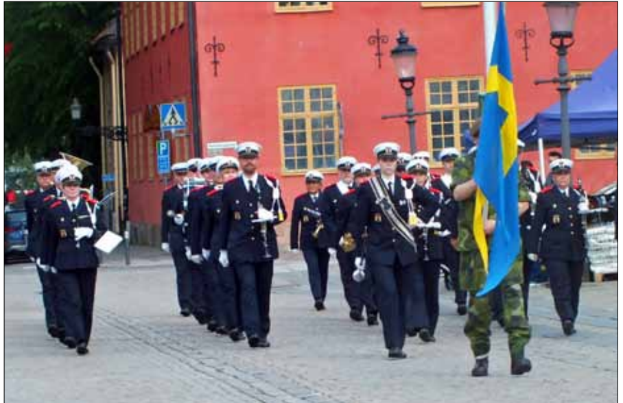
Nationaldagen, inmarsch på Stora torget

Nationaldagfirandet inleddes med en kort parad på Östra Storgatan och därefter en konsert på Stora torget i Nyköping. Efter en ytterligare kort parad fortsatte Nationaldagsfirandet på Vallarna vid Nyköpingshus där musikkåren svarade för ceremonimusiken. En välbesökt traditon i Nyköping. Årets högtidstalare var Riksdagens tidigare talman Per Westerberg.