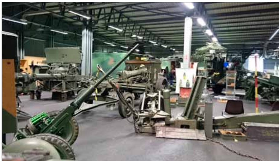
Då KA2 lades ned var det ett av Sveriges modernaste förband

litär utrustning från dess början tills nedläggningen år 2000.