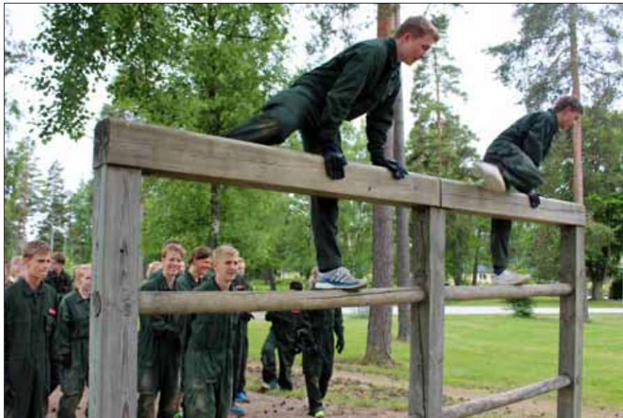
Även höga hinder måste övervinnas för att nå uppsatta mål

Vi fick utföra moment vi vanligtvis inte råkas med i vardagen, detta var bland annat att sitta i och ha delvis makt över segel och motorflygplan. Att få chansen att se världen från ett fågelperspektiv och samtidigt styra planet är en mäktig känsla. Ingen dag var lik den andra och det