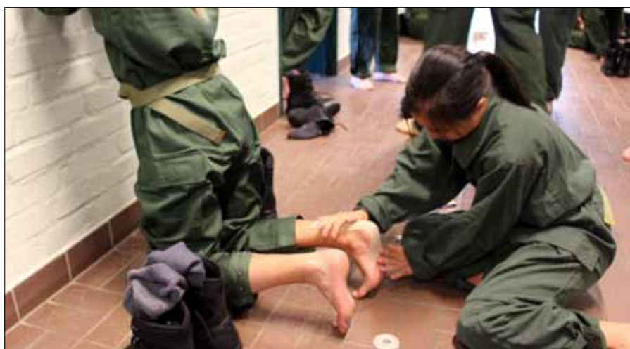
Vid flera övningar var fötterna elevens viktigaste resurs

Förresten, ljög jag lite, det absolut jobbigaste var att lämna alla sina kompisar på sommarkursen. Människor man endast känt i 2 veckor har blivit som ens familj, ens närmsta vänner och ovänner, för när man lever så tigt i 2 veckor lär man sig acceptera andras fel och brister men även kunskaper och erfarenheter. Avslutningsvis kan jag säga att detta var den bästa händelsen i mitt liv och att försvaret inte har sett mig för sista gången!