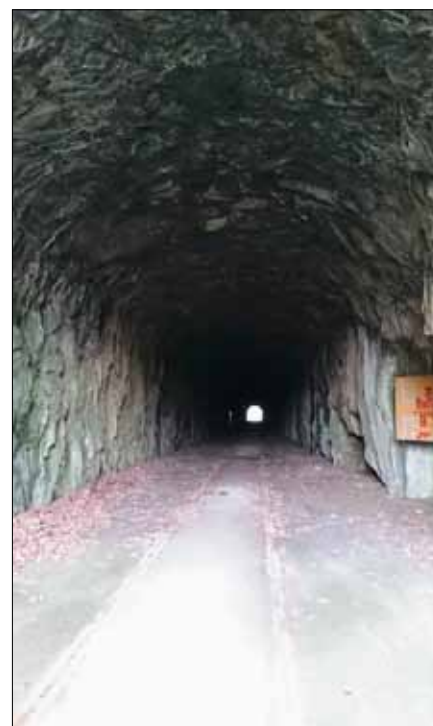
Tunnel rakt igenom Trossö

mycket tekniskt och låg långt fram inom många områden, t ex robotutvecklingen påbörjades redan under 1950-talet.