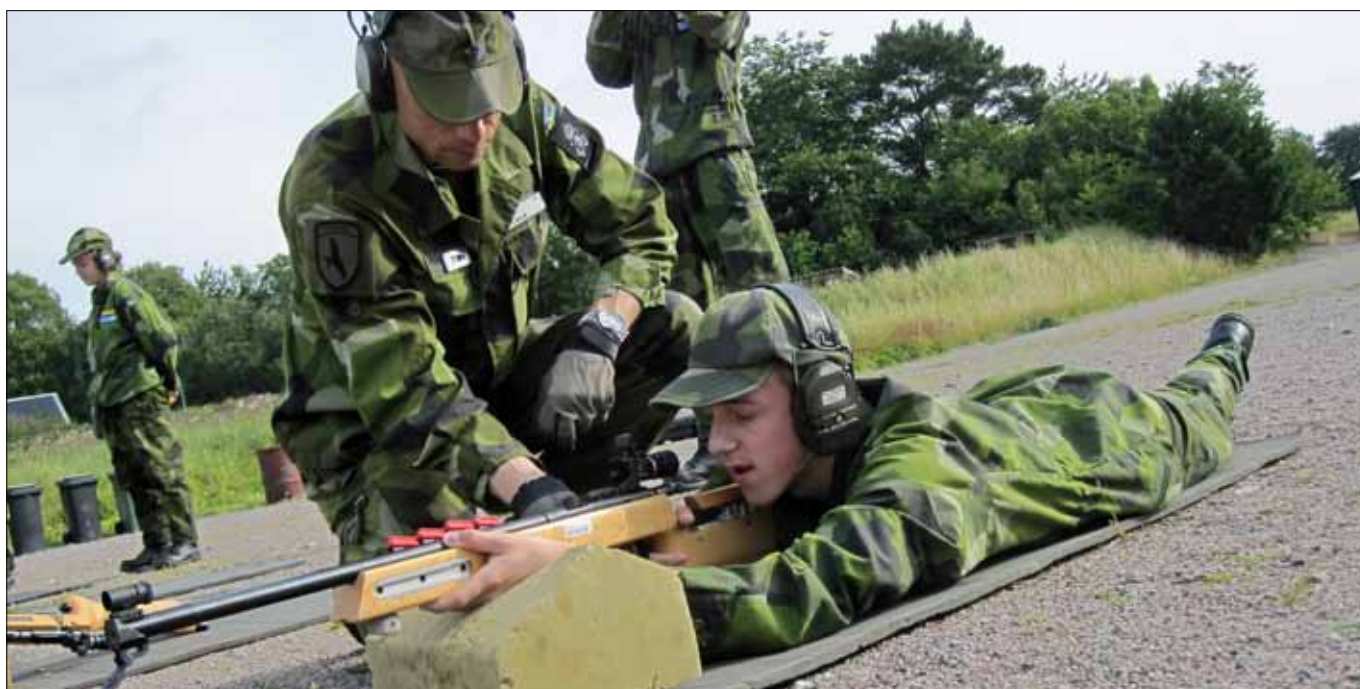
Här gäller det att hålla siktpunkt, riktpunkt och andan, då blir det träff i mitten av tavlan

Nästa stora prövning är tre dagar på Vaddö skjutfält. Vi ilastar lastbilar, bussar och andra transportmedel för några dagars utbildning och utbildningskontroll på Vaddö. Nervositeten brer ut sig då bara tanken på att bo i tält för många är främmande. Att de dessutom ska få sova utan tält en natt gör att det nästan går att ta på luften runt våra ungdomar. Sjuksköterska finns på plats för mer utbildning men inte minst för vår säkerhet då Vaddö ligger lite avsides och vi arbetar med ungdomar med i vissa fall ingen erfarenhet alls av skog mer än träden i stadens parker.