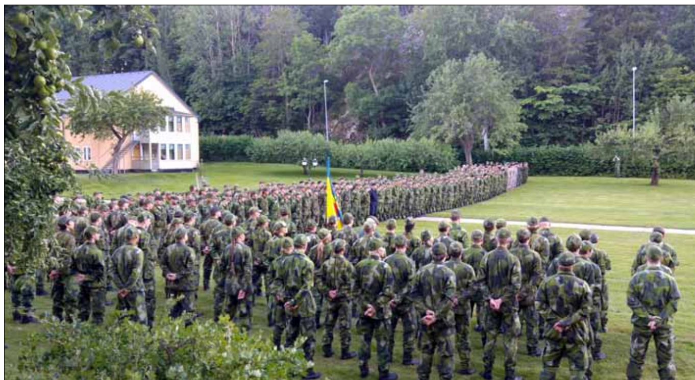
Samtliga tävlande lag uppställda under invigningen

Tävlingen avslutades på söndagen med en jaktstart där lagen skulle genomföra orientering, först lagvis