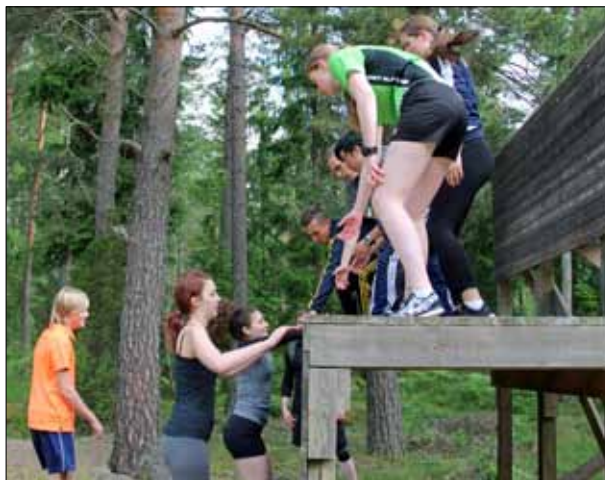
Eleverna fick prova på parkour

Dagens överraskning blev det när vädret visade sig vara så bra att alla fick följa med på en flygtur med Hkp 16, även mer känd som Black Hawk.