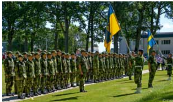
Fin avslutning med stolta föräldrar som åskådare

Väckning som vanligt på morgonen och avmarsch mot nya äventyr. Trötta men jättelyckliga att allt var över, satte de sig i bussarna. plötsligt stannar bussarna på andra sidan av Hunneberg mot Halleberg och avsittning kommenderades. Nu var det inte lika glada miner längre. Eleverna fick nu med all utrustning ställa