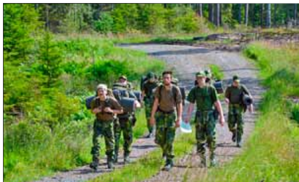
Marsch under strapatsövningen

Tyvärr så fick segelflygning med eleverna ställas in på grund av vädrets makter men denna tid utnyttjades då till skytte, sambandstjänst