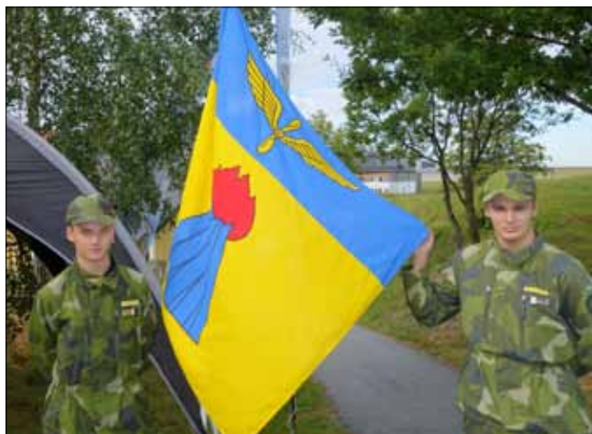
Två av FVRF Öst ungdomar på flygdagen