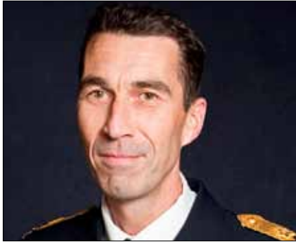
Micael Bydén, ny överbefälhavare och chef för Försvarsmakten.

Regeringen har den 9 september utsett generalmajor Micael Bydén till general och överbefälhavare. Han tillträder befattningen den 1 oktober, då nuvarande överbefälhavare Sverker Göranson avslutar sin tjänstgöring.