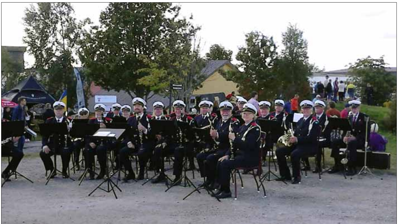
Orkestern samlad inför spelning. I bakgrunden skimtar FVRF ungdomars Infotält