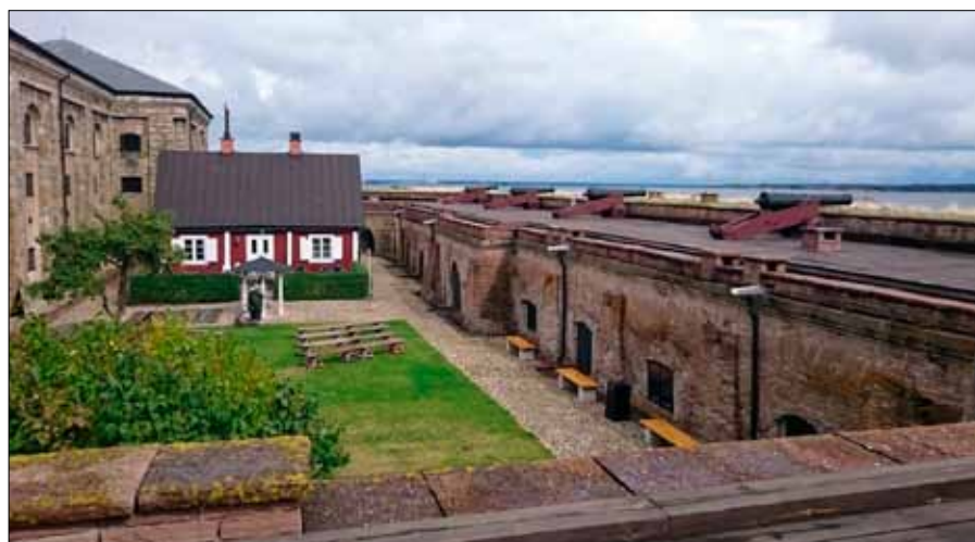
Vy från en av försvarslinjerna

De stora lokalerna gjorde att vi kunde se och pilla på all utrustning utan att bli blöta. Trots regnet på dagen uppmuntrades vi med deras valspråk: «Solen skiner alltid på en Kustartillerist».