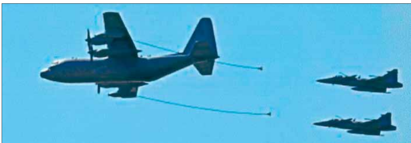
Lufttankning, från ett ombyggt Herculesflygplan till två JAS 39 Gripen, förevisades för första gången på en flygdag.

F 7 fyllde 75 år och Transportflygplanet TP 84 Herkules fyllde 50 år Närmare 50 000 besökare bedöms ha gästade Skaraborgs flygflottilj, F 7, under årets flygdag.