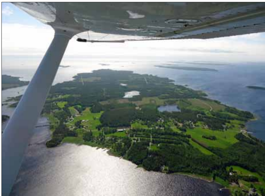
Flygtur med en vidunderlig utsikt

Det var få som kände någon bland eleverna när sommarkursen startade,