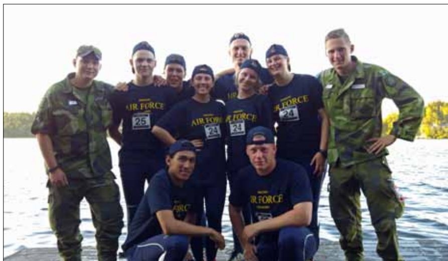
Båda lagen uppställda med sina lagledare

därefter i par. Därefter genomfördes snabbskytte och en snabbmarsch lagvis tillbaka till skolområdet där