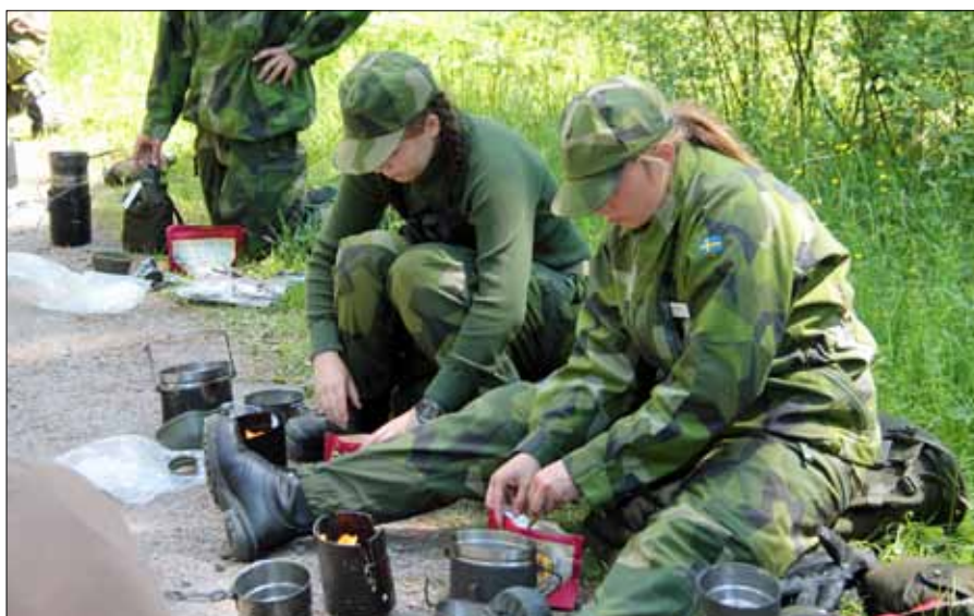
Tillagning av fältlunch

En yrkesinformatör från Malmen kom ut till oss och berättade om olika vägar att gå vidare och vilka yrken det finns i Försvarsmakten. Det var uppskattat och alla fick möjlighet att ställa sina frågor.