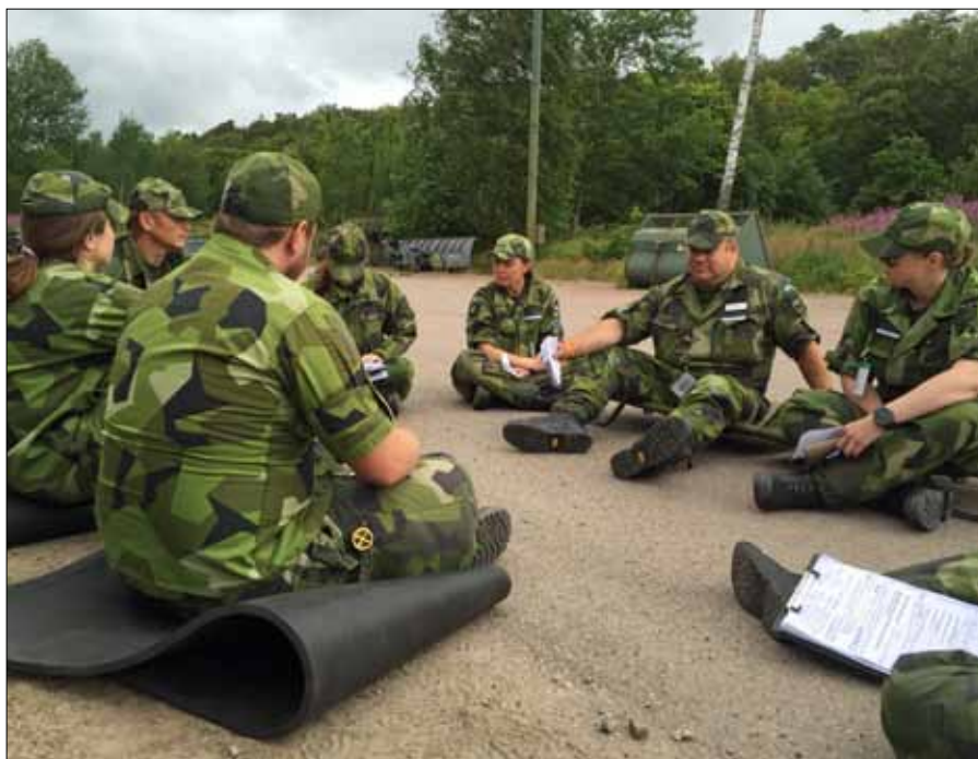
Elevernas feedback efter genomförd elevövning

ihop ledarskapssäcken kopplat till instruktörsrollen, vi beskrev utbildningsgången för eleverna och hur framtiden kan se ut. Kvällen avslutades med middag på Lv 6 officersmäss där det bjöds på buffé och dryck därtill en mycket trevlig kväll.