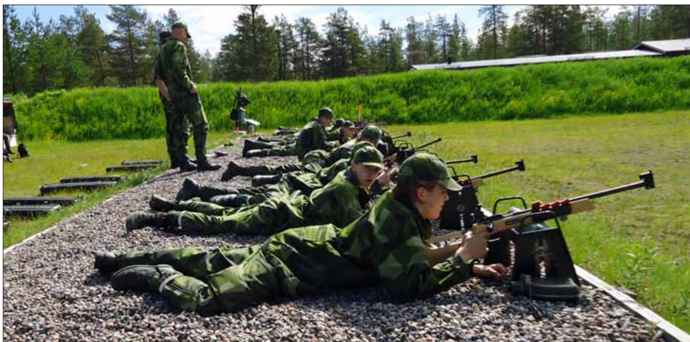
En dag på skjutbanan med träff i den svarta mittpunkten