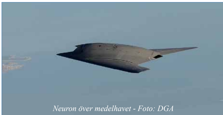
Neuron över medelhavet