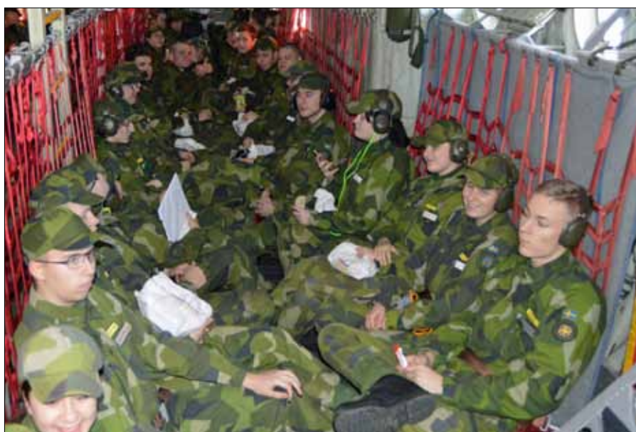
Förväntansfulla elever i lastrummet på C-130 Herkules

Kn Patrik Björnström/Kurschef