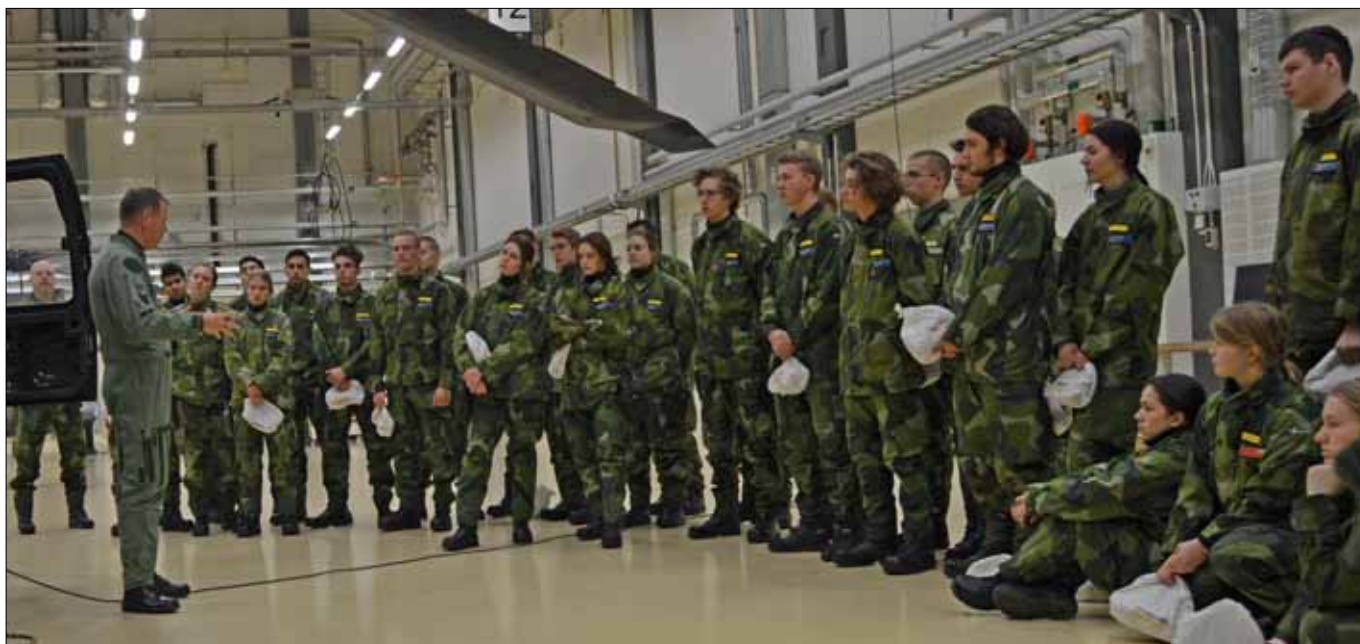
Eleverna lyssnar uppmärksamt på flygchefens genomgång

Helgen v 48 arrangerade Flygvapenregion Mitt en större utbildningshelg. En av kurserna denna helg var fortsättningskursen som fick en upplevelse utöver det vanliga. När kursen samlades på lördagsmorgonen väntade fotmarsch ner mot air-side där en C-130 Herkules strax landade. Fulla av förväntan fick sedan eleverna tillsammans med eleverna ur Lk stiga ombord och sätta sig tillrätta. Med applicerade hörselskydd på eleverna lyfte sedan flyget mot Malmslätt.