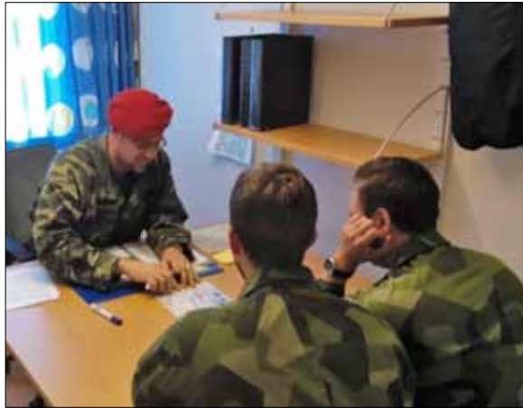
Manu ad ferrum - Var beredd på allt.

Blåland under ett års tid. FN deltog med en fredsframtvängande styrka där en svensk bataljon ingick.