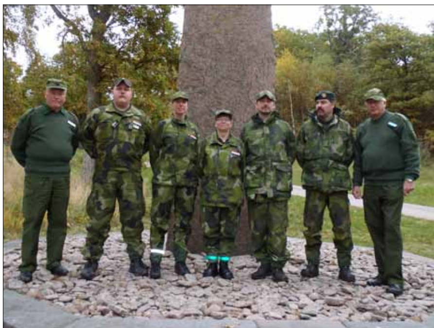
Kursfoto på Kurschefskursen med kursledning

Eleverna, samtliga med god och lång erfarenhet av instruktörsrollen, har nu tagit steget vidare mot att axla manteln som kurschefer.