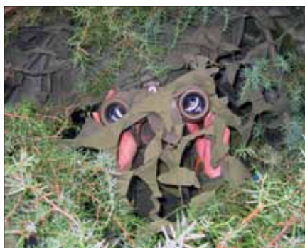
Se men inte synas - höra men inte höras

Av de ca 50 intresserade eleverna antogs 24 blivande spaningsoldater och utav dessa slutförde 23 soldater utbildningen med godkända resultat. Dessa spaningsoldater kommer nu att krigsplaceras på de olika HvUnd-