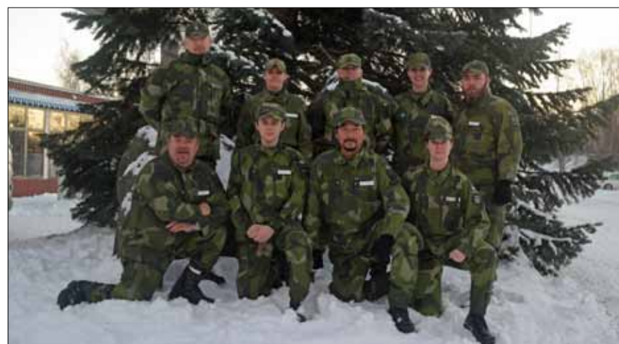
Kursfoto IK T, i ett vintrigt Umeå

förberedelsetiden väsentligt kortats i förhållande till IK G. Det innebar en större press på oss alla att prestera snabbare analyser, faktainhämtning och nedtecknandet av övningsplaner, inför våra kommande övningspass. Dessa skulle genomföras dag tre och fyra. Att vi var hänvisade till en ålderdomlig bläckstråleskrivare som skrev ut hellre än bra i ett sniggelliknande tempo, gjorde inte saken bättre... fast i fält har man ju ingen skrivare alls.