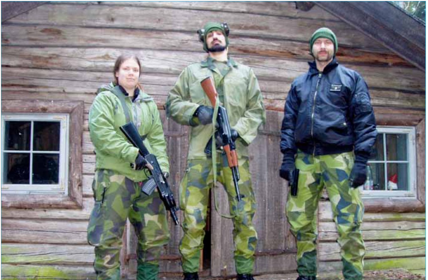
Tre av FVRF deltagare med en ytterst märklig utrustning, men för övningen helt rätt

jekt och påbörja förberedelse för sprängning och sabotage av dessa. Under flera dagar fick jag och min grupp åka runt omkring i trakterna och leta efter framrycknings- och tillbakaryckningsvägar, inbrytningspunkter, upphämtningsplatser m.m. Utöver detta fick vi även några andra uppdrag som dock inte blev av. Efter några dagar fick vi veta att vår plats blivit röjd och vi blev tvungna att flytta till ett annat gömställe. Där, natten mot lördag, exakt några timmar innan det första planerade attentatet skulle äga rum blev vi tillfångatagna av en inbrytningsstyrka (den övade FMUndSäkC personalen). Samtliga gripna transporterades till en bas och blev där placerade i celler. Resten av övningen, en och halv dag, tillbringade jag antingen i min