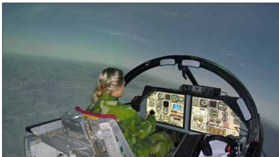
Här får en elev på MW prova på att flyga SK 60 (simulator)