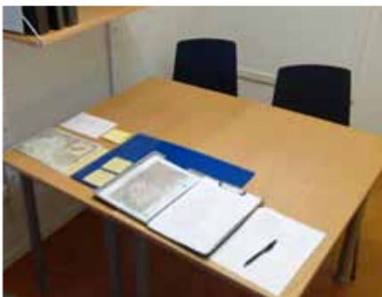
Preparatus supervivet - Förberedelser är alfa och omega.

Övningen utspelades i det fiktiva landet Rödland som varit i krig med