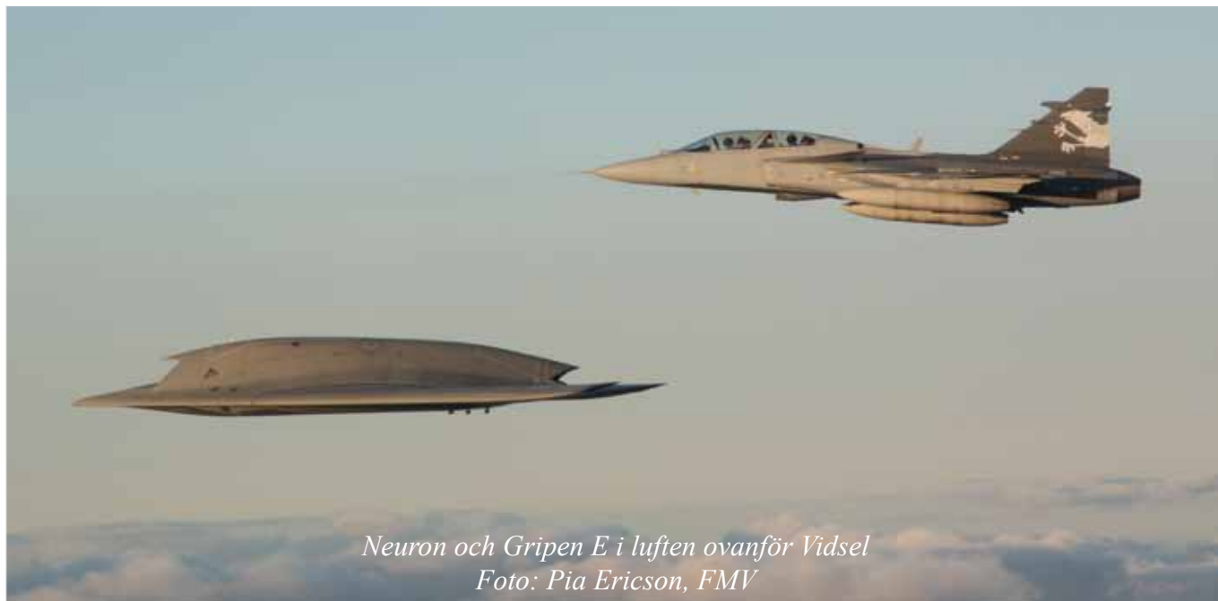
Neuron och Gripen E i luften ovanför Vidsel

I september genomförde FMV, Saab och Dassault provflygningar med den obemannade flygfarkosten Neuron. Det gjordes vid FMV:s provplats i Vidsel. – Syftet var dels att testa hur bra våra skarpa flyg- och markbaserade system ser Neuron, dels att se om Neuron verkligen är så bra som fransmännen säger, säger Anna Ljunggren, FMV Gripen biträdande projektledare för Neuron.