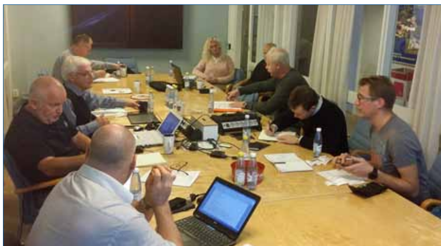
Kurschefer och personal från utbavd under planeringsarbete

Den 1 mars 2016 kommer att bli startdatum för att ansöka till sommarkurs, SK och då via vår hemsida www.fvrf.se