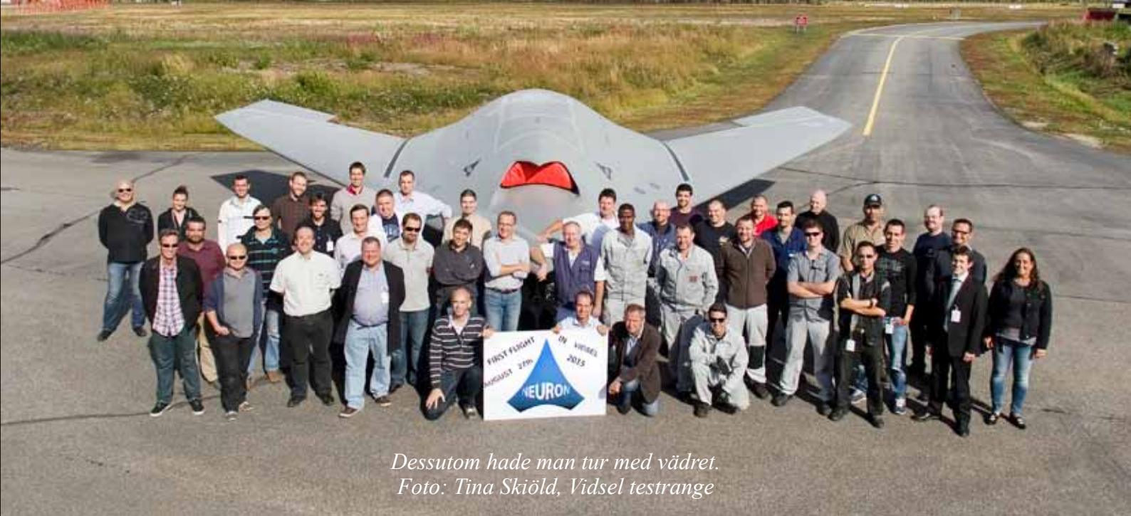
Dessutom hade man tur med vädret.

Det kan till exempel handla om att i en viss vinkel ska den ha så här stor radarmålarea, i en annan ska den synas så här lite inom IR-området, säger Anders Fredlund.