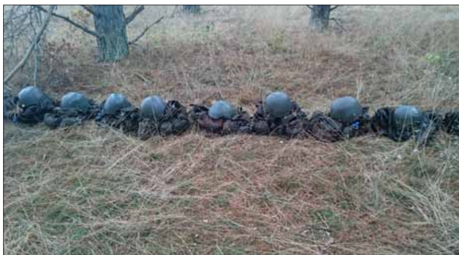
Ordning och reda i terrängen.