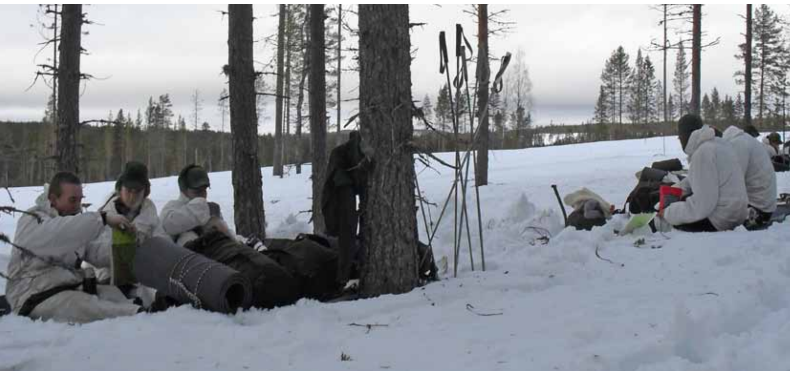
Bilden är tagen från en annan "kall" FVRF övning med ungdomar