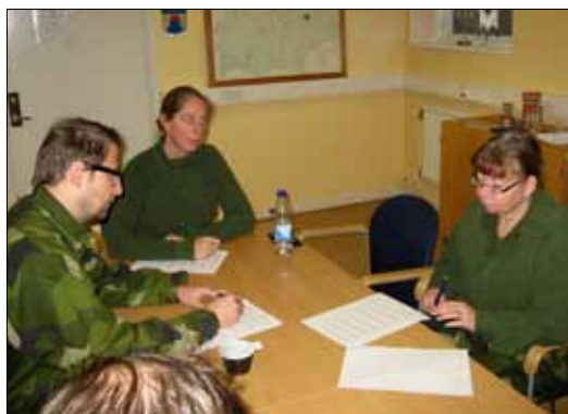
Tre av eleverna under grupparbete med att planera sina egna kurser

Bo Alfredsson och Jan-Erik Engström arbetade strukturerat och me-