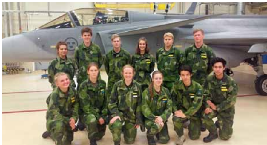
Gruppen framför en JAS

Andra dagen bestod av ett besök på 1. Helikopterskvadron och Flygmuseet utanför F 21. Eleverna fick följa med en helikopterpilot och en helikoptertekniker och både se och höra hur