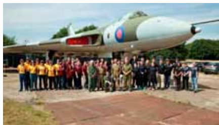
Hela gruppen med de länder som ingick i vår grupp under RIAT.

På kvällen delades vi in i nya grupper, nu tillsammans med övriga ungdomar