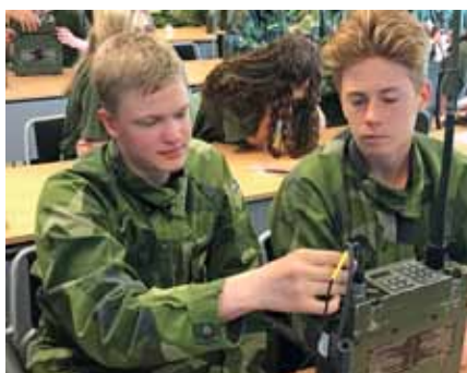
RA 180 är den militära beteckningen, men vi hittar inga appar

Till allas vår glädje får vi samtidigt se hur återuppståndna Team 60 övar i luften ovanför oss! Team 60 utgörs av de bästa bland de bästa flyglärarna som utöver sin vanliga tjänst som flyglärare dessutom arbetar med