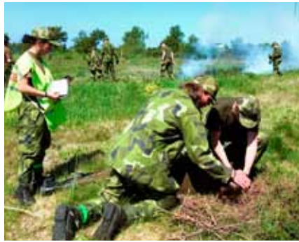
Övning i sjukvård, här lyckades vi bra

var något som sedan visade sig vara felaktigt, pengar fanns det gott om men något att köpa för dem fanns det inte. Redan första natten tog övningen en oväntad vändning, ungdomarna väcktes upp för att transporteras ut mitt i skogen utan vare sig mat eller mobiler. Inledningen på övningen, som först hade sett relativt chill ut, blev istället en kamp om att övervinna magens kurrande och saknaden av att konstant ha en mobil i handen.