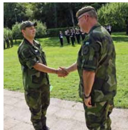
Lagledare för "Flyboys" tar emot hederspris för bästa svenska lagledare.