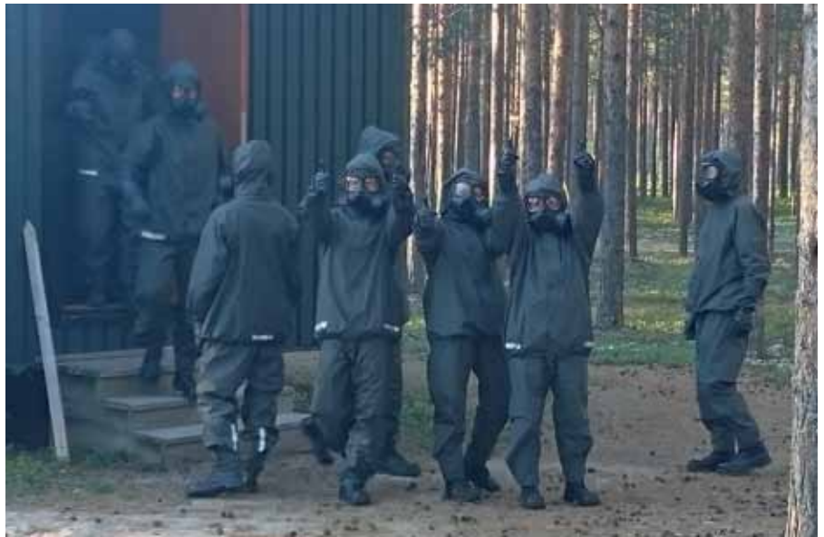
Täthetsprov med skyddsmask, "Tätt var det här"

I mitten av andra veckan avslutades skyttet och kursen gick snabbt vidare mot den stundande tillämpningsövningen. Kursen blev väckt tidig morgon, satt i stridsberedskap och sedan transporterad till okänd plats för att där påbörja sin gruppvisa förflyttning. Under fotmarsch genom skog och