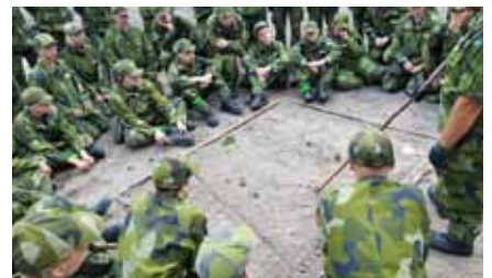
Ordergivning i terrängen

till flottiljen, och alla kom tillbaka trötta, nöjda men inte minst hungriga. Kursen avslutades traditionsenligt med tacos och prisutdelning.