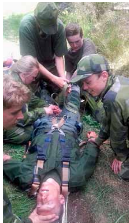
Sjukvårdsutbildning, ser riktigt illa ut, tur att det är övning

och tankeförmågan sattes på hårda prov. När det oändligt långa dygnet var tillända var vi nu plötsligt framme vid den allra sista kvällen och kursen avnjöt en fin trerättersmiddag, samtidigt som Stabschefen F 7 förrättade prisutdelning till såväl till bästa grupp under strapatsen men också till bästa skytt och bästa elev. Den sista dagen genomfördes en föreläsning i form av olika stationer för närmare 300 nyfikna anhöriga för att till sist avsluta hela kursen med en diplomceremoni i parken.