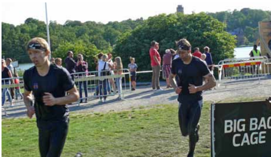
På väg mot mål, på en bra tid

Text, Moa Leidhammar/FVRF-S