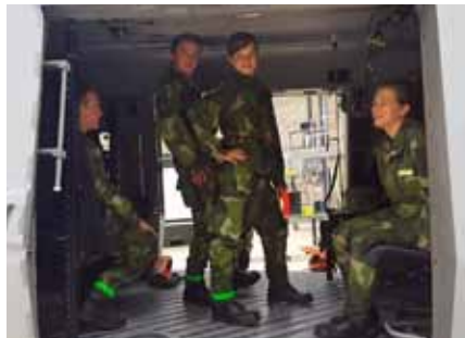
Vad spännande det var att provsitta en helikopter

byggande av o-plats. Efter att alla grupperna hade utfört det hela så var det dags för nästa steg i förläggningstjänst, vilket var att bygga vindskydd. Andra natten ute i fält var inte lika populär som första då det klagades på mygg och att det var kyligt. Ungdomarna var relativt redo på vad dagen skulle erbjuda, det var dags för gruppfälttävlan. Kartor på området delades ut till grupperna och