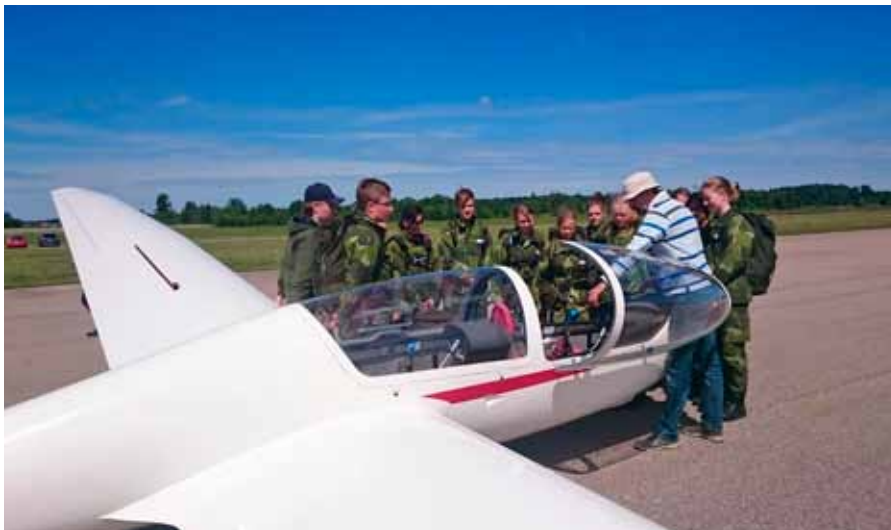
Dags för segelflygtur, jättespännande

När kursen gick in på sjätte dagen ändrade innehållet tema, från studiebesök och utbildning, till att nu bege sig ut i skogen för ett så kallat fältvanedygn. Kvällen avslutades i solnedgången med en "elevafton" där man grillad korv och genomförde en "backspegel" från veckan som varit. Nu var kursen inne på andra veckan och vi växlade upp tempot ytterligare, om det nu går att öka mer från full fart. Vi ilastade en Hercules och flög till Ronneby, för att sedan bege oss till Karlskrona och besöka Marinmuseet, för att på så sätt utforska en annan del av Försvarsmakten. Samtidigt passade Sommarkursen som var på