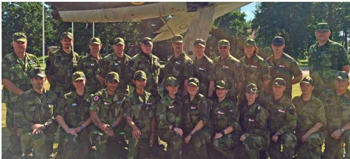
IKG gruppbild med elever och lärare