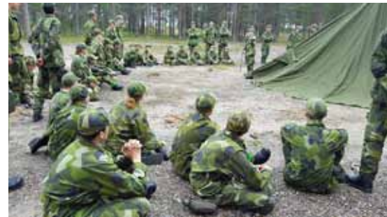
Teoripass före upprättande av egen förläggningsplats

till flottiljen, och alla kom tillbaka trötta, nöjda men inte minst hungriga. Kursen avslutades traditionsenligt med tacos och prisutdelning.