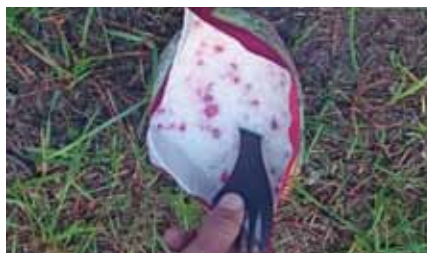
Hur många lingon finns det i Norrland

mark testades inhämtade kunskaper i sjukvård, vapentjänst, folkrätt och stridsvärde. Tältförläggning byggdes samtidigt som kursdeltagarna förde en mindre framgångsrik strid mot skogens alla mygg.