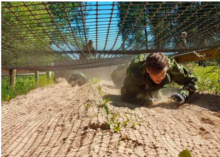
Kul att prova på hinderbanan, men jobbigt

Ronneby på att flyga till Linköping med "vårt" flygplan.