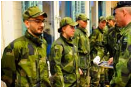
Totalförsvarsplikten gäller lika för kvinnor och män.

Regeringen beslutade den 2 mars att totalförsvarspliktiga kvinnor och män ska vara skyldiga att genomgå mönstring och fullgöra grundutbildning med värnplikt. Försvarsmakten ska planera för att minst 4 000 personer per år ska genomföra grundutbildning med värnplikt under 2018 och 2019.