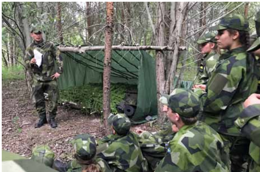
Här ska ni bo i natt, skärmskydd kallas bostaden

sjukvård. Utbildningsmoment i hur man tar sig fram nattetid, vass egg och eldning leder sedan fram till tillämpade moment där grupper ska göra upp eld på tid och ta sig fram i ett koordinatsystem med hjälp av karta och kompass. En natt sov man gott i Tält 20 med en kamin som eldposten höll varm. En natt tillbringades i enmanstält och för delar av kursen var det nog något de kommer att minnas särskilt länge. Bilden på den fina bivacken som ser torr och skyddad ut ger högklassisk vila i jämförelse med enmanstält som redan innan nattvilan har blivit regnvåta och kalla.