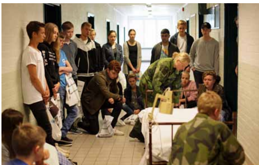
Tänk vad invecklat en sängbäddning kan vara