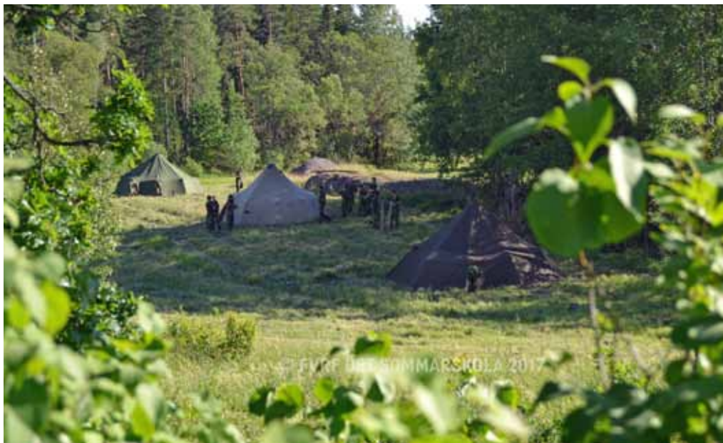
Vilken förläggningssmiljö, här skulle man kunna bo hela sommaren