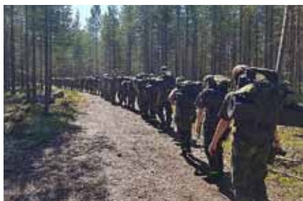
Här startar långmarschen, framåt!

de var snabbt iväg för att hitta rätt. På vissa ställen så skulle de bland annat klyva ved, göra upp eld på snabbast möjliga tid, sätta ihop en bår och svara på olika frågor. Slutmålet var att orientera sig tillbaka