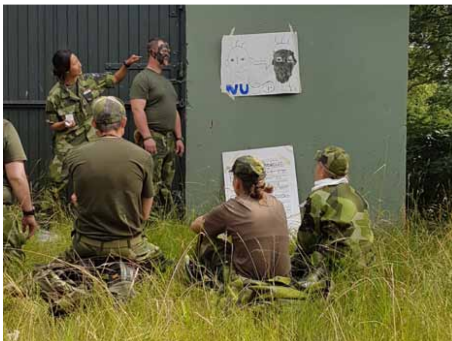
Elevövning i maskeringens ädla konst, här blir alla osynliga