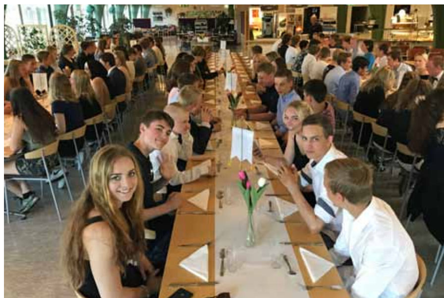
Avslutningsmiddag, trevligt men samtidigt ett ledsamt uppbrott

Sista dagen på kursen kombinerades med besöksdag för anhöriga. Närmare 200 personer hörsammade inbjudan. Det fanns tyvärr bara möjlighet att ge ett smakprov av allt som ungdomarna fått uppleva, men en hel del av allt som de fått sig till livs kunde visas upp. Utrustade med RA 180 ledde ungdomarna runt sina anhöriga. Föreläggingsmaterial och dygnsportioner, praktisk sjukvård