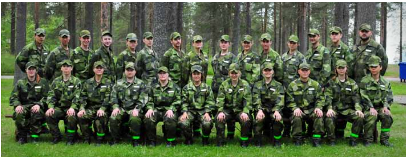
En mycket prydlig grupp som genomförde GU-F med godkända resultat