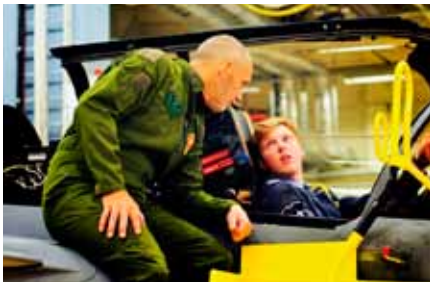
Att få provsitta en JAS, en dröm för många.

Besöket inleddes med en resa genom Stockholmstrafiken i rusningstid för att sedan ta oss till Linköping. Efter mat och en god natts sömn var det dags för besök nummer ett, flygskolan på Malmen. Våra gäster som trodde att det skulle få en vanlig genomgång av flygplan och vad man gör blev glatt överraskade, jag tror till och med att deras mungipor var på väg runt huvudet när de fick veta att de skulle få varsitt flygpass i en SK 60. Sällan kan så många brittiska leenden skådats samtidigt på flygskolan. Det blev heller inte sämre när man fick möjlighet att se Team 60 uppvisningsträna under eftermiddagen. Som att det inte var nog bjöd den andra dagen på ett besök på helikopterflottiljen och som avslutning bjöds det på en flygtur i Hkp 15.