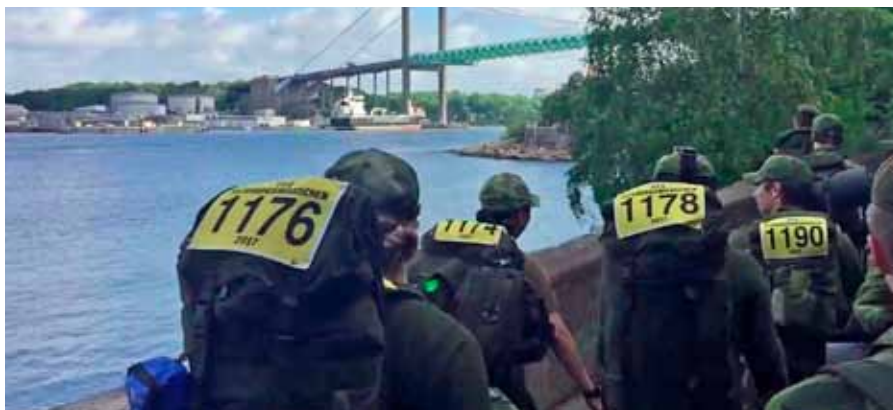
Äntligen på väg, nu gäller det att marschera på och hålla ihop

Första etappen gick av stapeln på lördagsmorgonen och bjöd på en rundtur i centrala Göteborg. Samtliga i gruppen genomförde Försvarsmaktens soldatprov, och för att erhålla