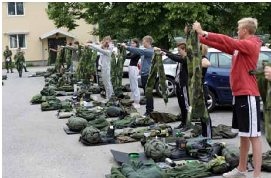
Här gäller det att hålla rätt på prylarna

Under andra veckan så skiftar fokus från lektionssalen till skogen, resning av tält 20 övas, eldpostlistor skrivs och fältrutiner går igenom. Allt detta för att vara förberedda för de fältdygn som genomfördes onsdag morgon-torsdag natt. Under fältdygnen fick eleverna en fördjupad kunskap i förläggningstjänst och tält