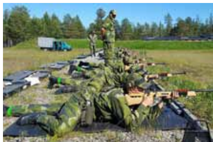
Utbildning på ungdomsvapen kaliber .22 long

byggande av o-plats. Efter att alla grupperna hade utfört det hela så var det dags för nästa steg i förläggningstjänst, vilket var att bygga vindskydd. Andra natten ute i fält var inte lika populär som första då det klagades på mygg och att det var kyligt. Ungdomarna var relativt redo på vad dagen skulle erbjuda, det var dags för gruppfälttävlan. Kartor på området delades ut till grupperna och