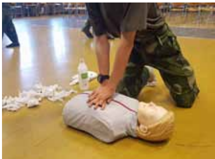
Träning i olika sjukvårdsmoment

I början av juli ryckte 65 ungdomar in till sommarkurs på F 21 i Luleå. Fulla av förväntan så påbörjades allt enligt rutin med ett klassiskt upprop under söndagseftermiddagen. Ungdomarna utrustades och fick både lära sig stå och gå. Veckan rullade på i sann FVRF-anda med diverse utbildningar så som skarp egg, sjukvård, sambandstjänst med radio 180, säkerhets och materiel kunskap och skytte med ungdomsvapen .22 long.