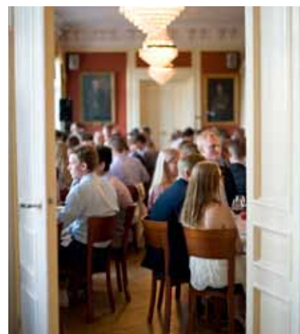
Avslutningsmiddag i gammaldags fin miljö

Det jag vill framhålla till mina kolleger runt om i landet är att man med fantasi, ett bra befälslag samt ett gott stöd kan få till en mycket bra verksamhet för ungdomarna, även om man har begränsade resurser och