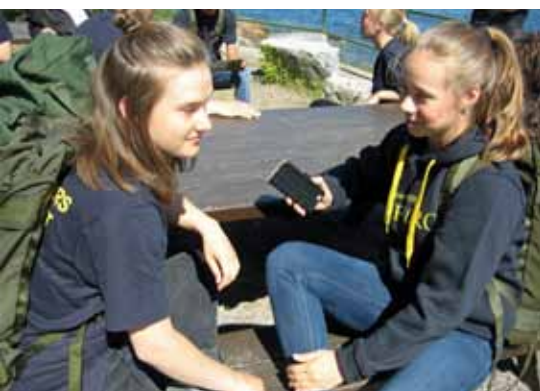
Nu måste vi ringa hem och höra om de saknar oss

sjukvård. Utbildningsmoment i hur man tar sig fram nattetid, vass egg och eldning leder sedan fram till tillämpade moment där grupper ska göra upp eld på tid och ta sig fram i ett koordinatsystem med hjälp av karta och kompass. En natt sov man gott i Tält 20 med en kamin som eldposten höll varm. En natt tillbringades i enmanstält och för delar av kursen var det nog något de kommer att minnas särskilt länge. Bilden på den fina bivacken som ser torr och skyddad ut ger högklassisk vila i jämförelse med enmanstält som redan innan nattvilan har blivit regnvåta och kalla.