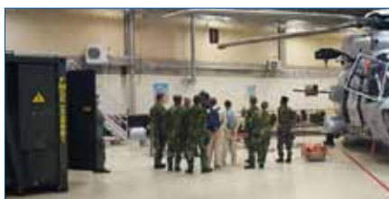
Besök i helikopterhangaren

Veckan därpå så påbörjades fältövningen. Packning på och ut i skogen. Fältövningen startade med förläggningstjänst med tält 20. Första natten ute i fält var ”störtskönt” som några av eleverna uttryckte sig. Sen var det dags att riva förläggningen för att sedan utföra avmarsch mot nästa utbildningsmål, brandsläckning och