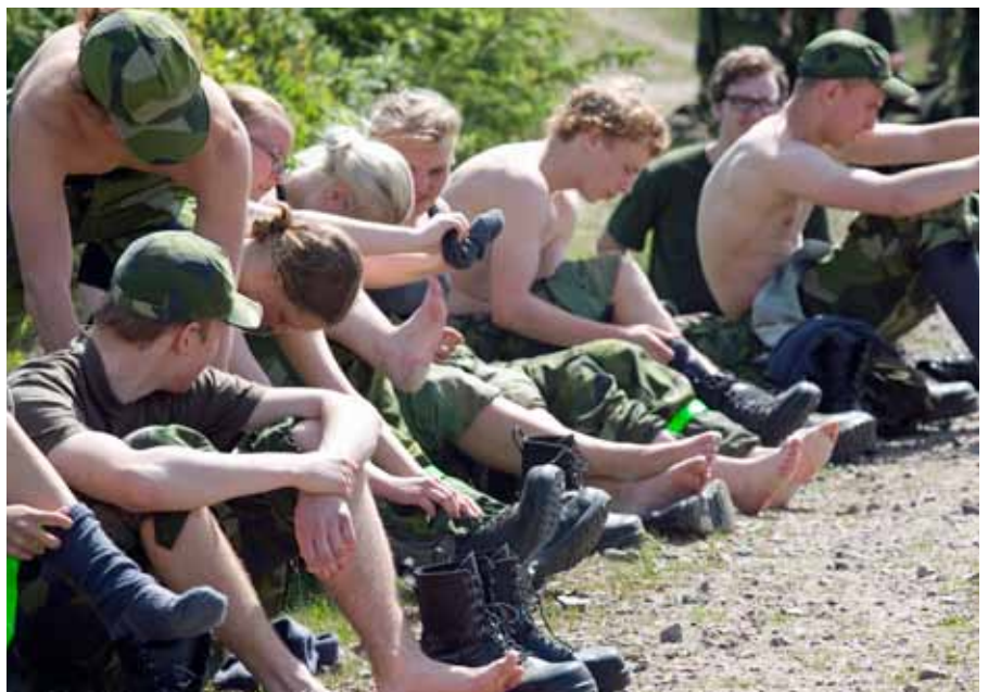
Fötterna är soldatens bästa vän, behandla de därefter

Precis som alltid gick helgens övning alldeles för fort och precis som åren innan var det lite vemodigt att säga adjö till alla på söndagen. Årets vemod slår dock inte fjolårets när jag gick ut LK 2. Jag hade gått ut det sista kurssteget och var därmed klar med ungdomsverksamheten men vad jag inte visste då var att detta bara var början. I höstas när ett nytt kursår drog igång var jag åter på plats, men med den lilla skillnaden att jag nu var med som funktionär. Det gångna året har varit bra och jag har sakta vaggats in i en ny roll. Jag är inte längre ungdom men jag är fortfarande en del av ungdomsverksamheten och det jag har lärt mig är att allt har sin tid. Slutet på årets utbildning var inte alls lika sorgligt som fjolårets, jag ser istället fram emot av vad framtiden har att