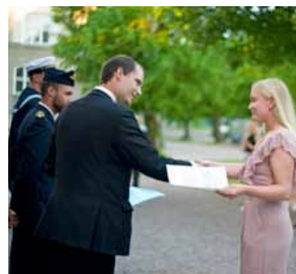
Högtidlig avslutning med utdelning av kursintyg