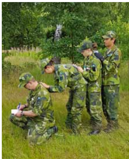
Fortlöpande feedback, skrivunderlägg är beställda

Försvarmaktens Ledarskaps- och pedagogikenhet (FMLOPE) är kvalitetssäkrare av kursinnehållet i IK G och ansvarar för att kursinnehållet överensstämmer med Försvarmaktens grundsyn inom sakområdet Pedagogik. Under våren har AG Instruktor – med stöd från FMLOPE – tagit fram ett förändrat sätt att genomföra IK G och IK T. Detta fastställde HKV PROD FRIV i maj. Från Flygvapenfrivilliga har bl a kn Thom Gustafs-