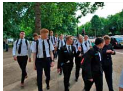
På vandring i London

Vi bytte förläggningssort från Fairford till Halton där det på kvällen bjöds på middag i The Halton House, en pampig byggnad som uppfördes till Alfred de Rothschild, idag officersmäss för RAF Halton.