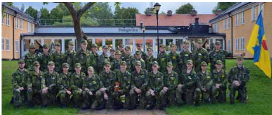
Hela FVRF styrkan samlad inför HvSS ungdomstävling

Båda lagen var redo för söndagen där det skulle ske en jaktstart. Ju mer poäng man hade desto tidigare startade man. Pojklaget gick ut först av samtliga 72 lag. Tjejlaget startade ungefär en timme efter. Redan från start var det spänning, pojklaget hade ett lag bakom sig som var farliga, de startade bara tre minuter efter. Dock redan efter första delmomentet som bestod av "par-orientering" såg man att pojklaget hade ökat sin ledning. Efter andra momentet som var "lag-orientering" såg man att pojklaget hade första platsen med stora marginaler och så blev det. De kom in på första plats med hela 34 minuters mellanrum till nästa lag. Under tävlingens gång hade tjejlaget en tuff fight om en tredje plats. Inte förens när det var ca 500 meter kvar av snabbmarschen som var sista momentet på söndagen lyckades de springa om laget framför de och ta åt sig en tredje plats. De två lagledarna kunde inte vara mer stolta!