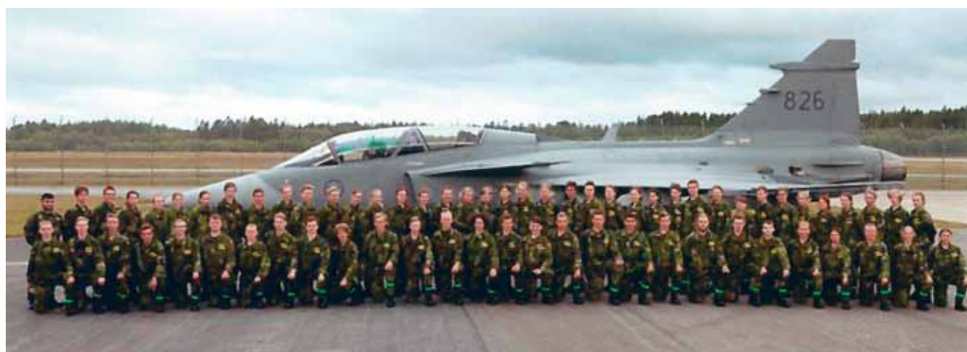
Hela kursen samlad