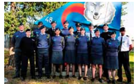
Svenska och brittiska deltagare vid fenan från Akktu Stakki innan vi lämnade F 21.

av en guide. Imponerade av det storslagna vattenfallet var det sedan dags att åter bege sig mot Kallax och lite lokal mat. Vad är då lokal mat i Kallax? Jo surströmming. Trots många tveksamheter så smakade alla på det. Betyget var varierande, från riktigt