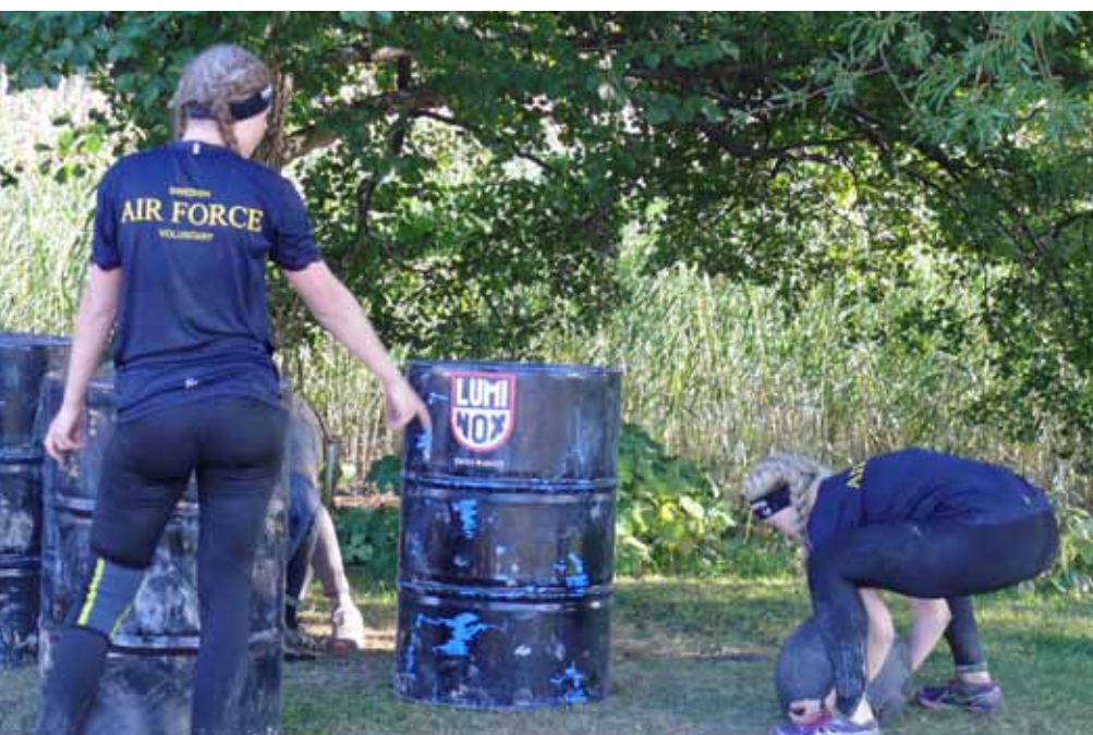
Varför ska det vara så tungt

Killarna var mycket nöjda med sin prestation och de överträffade sin målsättning som var att komma i mål inom två timmar. En av killarna vann sin åldersklass och de andra två kom