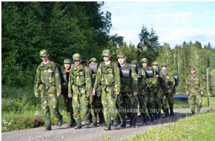
På marsch mot okänt mål, men vi kom hem till slut

att man alltid orkar lite till, oavsett hur trött man är. Under helgen hanns det med en hel del, både lekar, fysiskträning, flygvapenmuseum och avslutningsmiddag. Avslutningsmiddagen hölls i Flygets Hus som idag ligger utanför Flottiljområdet, det var här den gamla underofficersmässen var. Med catering från Golfhotellet så blev det en väldigt trevlig kväll.