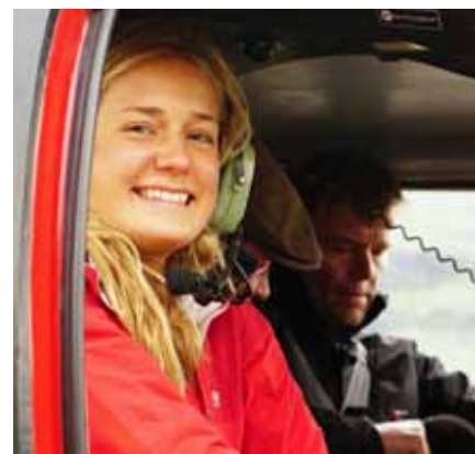
Spännande att flyga Helikopter, fin utsikt och snabbt går det