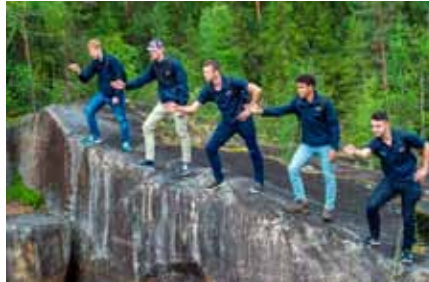
Besöket vid Storforsen utanför Vidsel.

I ett rasande tempo var det plötsligt fredag och ett besök på SAAB i Linköping med lite genomgång av företaget och en promenad genom slutmonteringen. Efter det styrde vi kosan mot Flygvapenmuseum, och jag tror det flesta av våra gäster fick lite gåshud när vi kom ner till vraket efter DC 3:an och historien om den.