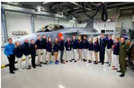
Besök vid 211:e JAS-divisionen på F 21.