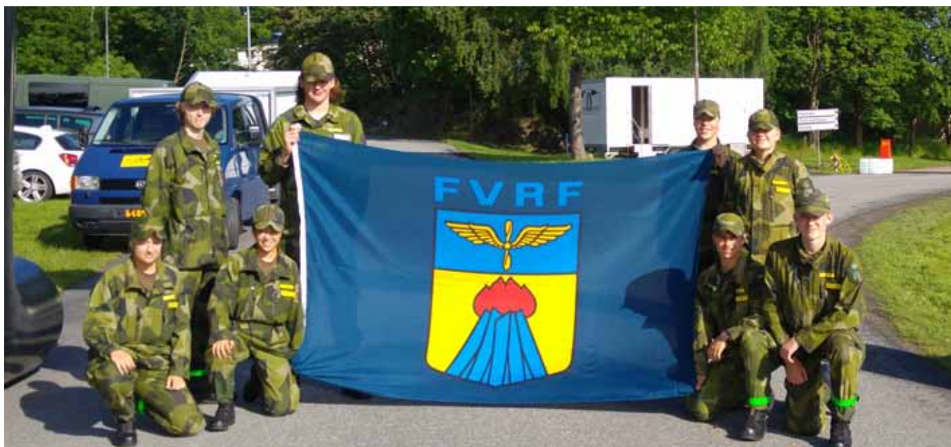
Här är FVRF Syd grupp före start