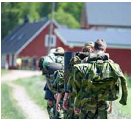
Här ger vi oss av indelade i grupper

Årets slutövning presenterades som operation Guldbyxor där hela övningen skulle bygga på ett Monopol-koncept där ungdomarna tjänade pengar som de sedan skulle kunna köpa mat och annan förnödenhet för. Detta