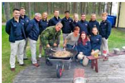
Nöjda brittiska besökare efter att man fått souvas till middag. Surströmmingen fick lite mer blandat omdöme.

Fredag kväll, och transport från Östergötland till Norrbotten och Luleå med hjälp av ett av Flygvapnets Herculesflygplan för att på lördagen besöka flygdagen. Trots isande kalla vindar så var besöket en succé och efter en middag fick de en chans att se sig om lite i Luleå. När söndagen grydde lastade vi in oss i bilar och åkte västerut mot Vidsel för att besöka Storforsen med hjälp