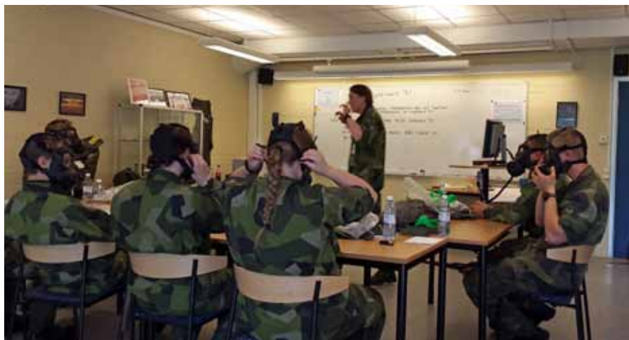
Elevlektion i Skyddsmasken