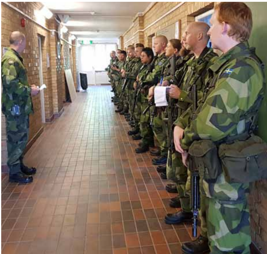
Säkerhetsgenomgång innan grupperna beger sig ut

Dagen därpå påbörjades själva övningen. De sista kartorna plastades, grupperna kördes i väg, en efter en, och landsattes på olika platser i övningsvärlden. Solen stekte och världen vi steg in i var tård och spänd av mångåriga, infekterade konflikter – både med grannländer och internt