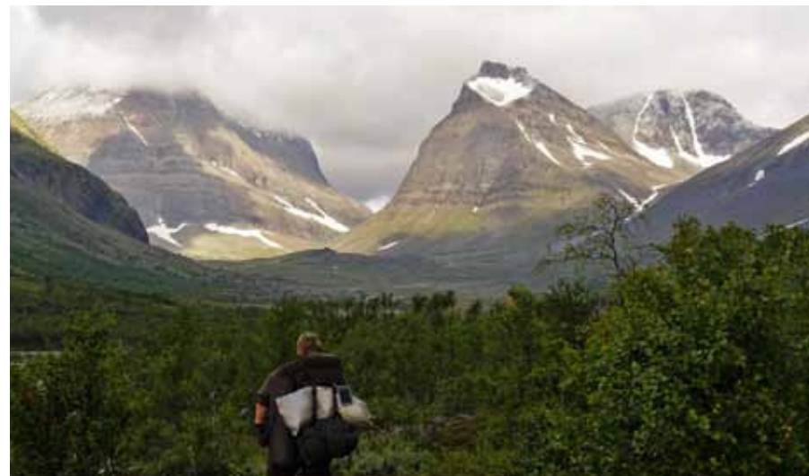
På väg mot målet i vacker miljö, men oftast i svårframkomlig terräng

åkte expeditionsdeltagarna helikopter över berget, vilket var mycket uppskattat. Att först ha sett berget nerifrån och sedan traska den långa vägen upp, till att sedan se berget och de fina landskapen ovanifrån var en mycket fin och häftig upplevelse. Framförallt för oss flygintresserade. Nu hoppas expeditionsdeltagarna på att bestigningen av Kebnekaise ska bli en tradition inom Flygvapenfrivilliga. De var faktiskt inte först med att ge sig ut på detta äventyr, tidigare har ungdomar från region Syd genomfört samma resa.