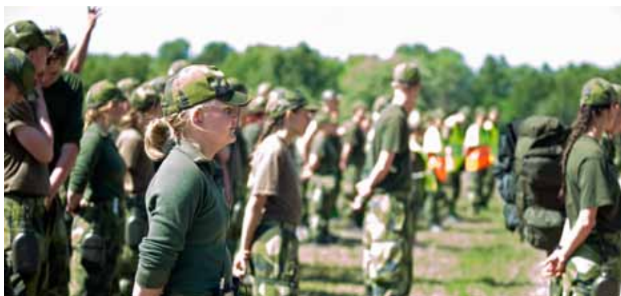
Uppställning och genomgång före övning

Ulf Hörndahl Övningsledare FVRF-S Majövning