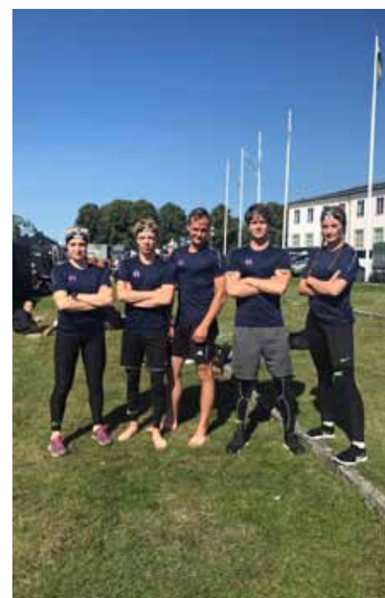
Fem målmedvetna ungdomar