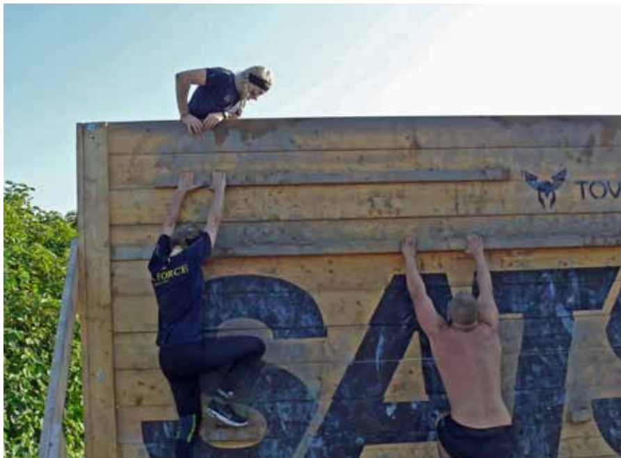
Här gäller det att komma över och sedan snabbt i mål

När vi kom dit var vissa av oss lite nervösa men alla var väldigt förväntningsfulla och taggade på vad som komma skall. Det hela inleddes med att vi skulle checka in och få ut våra startkitt. Startkitten innehöll startnummer i form av pannband och en GPS-sändare som skulle hålla koll på vår tid. Vi satte på oss vår utrustning och fixade till det sista. Därefter var det dags att ställa sig vid startlinjen, vi var minst sagt väldigt taggade. Vi hade sedan en kort gemensam uppvärmning med alla andra deltagare som skulle starta samtidigt med oss.